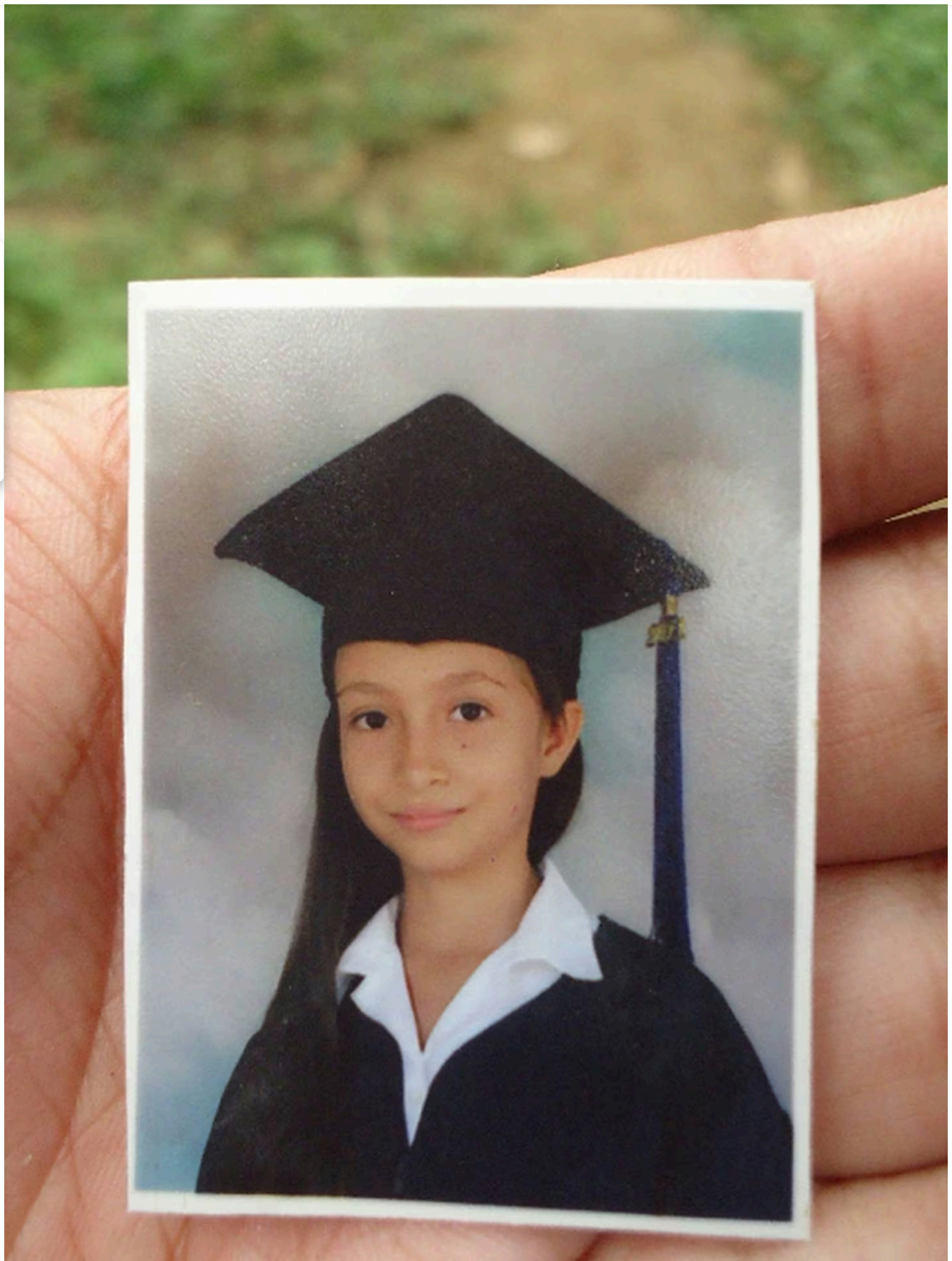
La adolescente era una estudiante aplicada soñaba con ser una maestra.