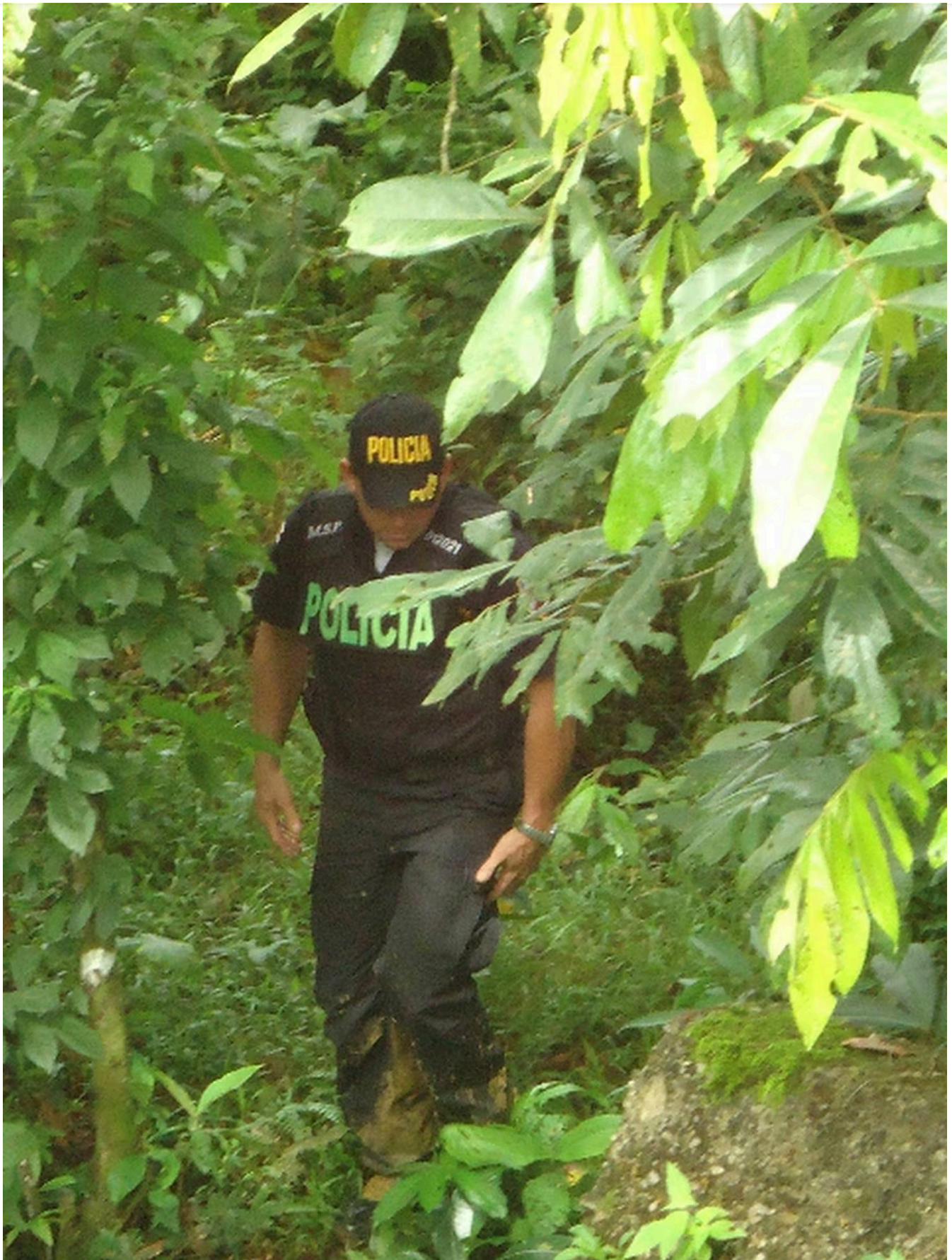
El lugar era solitario y hace diez años había mucha lluvia y barro, en la imagen parte de los policías que buscaron a la niña.