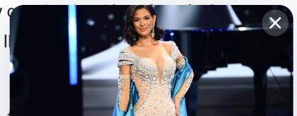
TELEGUÍA FARÁNDULA TELEGUÍA FARÁNDULA VIVA Sheynnis Palacios, actual Miss Universo, visitará Costa Rica el 27 de febrero