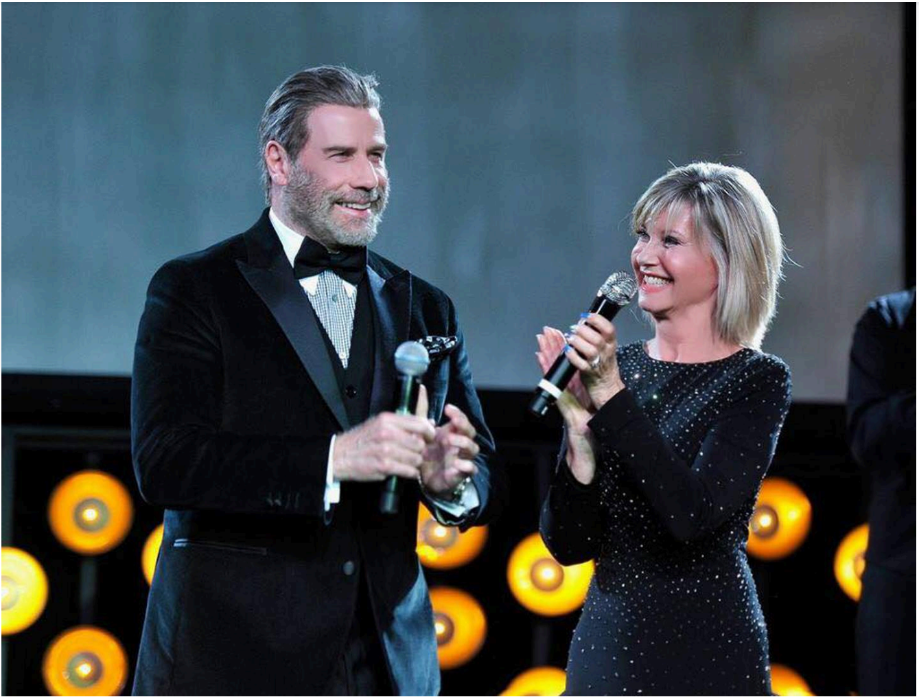
Olivia Newton-John y John Travolta, los protagonistas de la película Grease muchos años después.

Hacia 1983 se mete a empresaria y abre sus cadena de tiendas Koala Blue, más tarde contrae matrimonio y se convierte en madre. En paralelo empezarán a emerger nuevas figuras femeninas en la escena pop, como Madonna o Cyndi Lauper, con una propuesta e imagen más disruptiva a tono con la segunda mitad de la década y consecuentemente el brillo de Olivia empezaría a mermar.