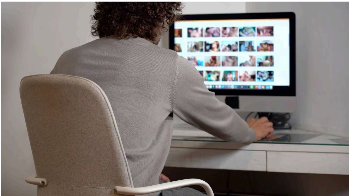
La exposición a la pornografía es uno de los principales indicadores en adolescentes con conductas sexuales.