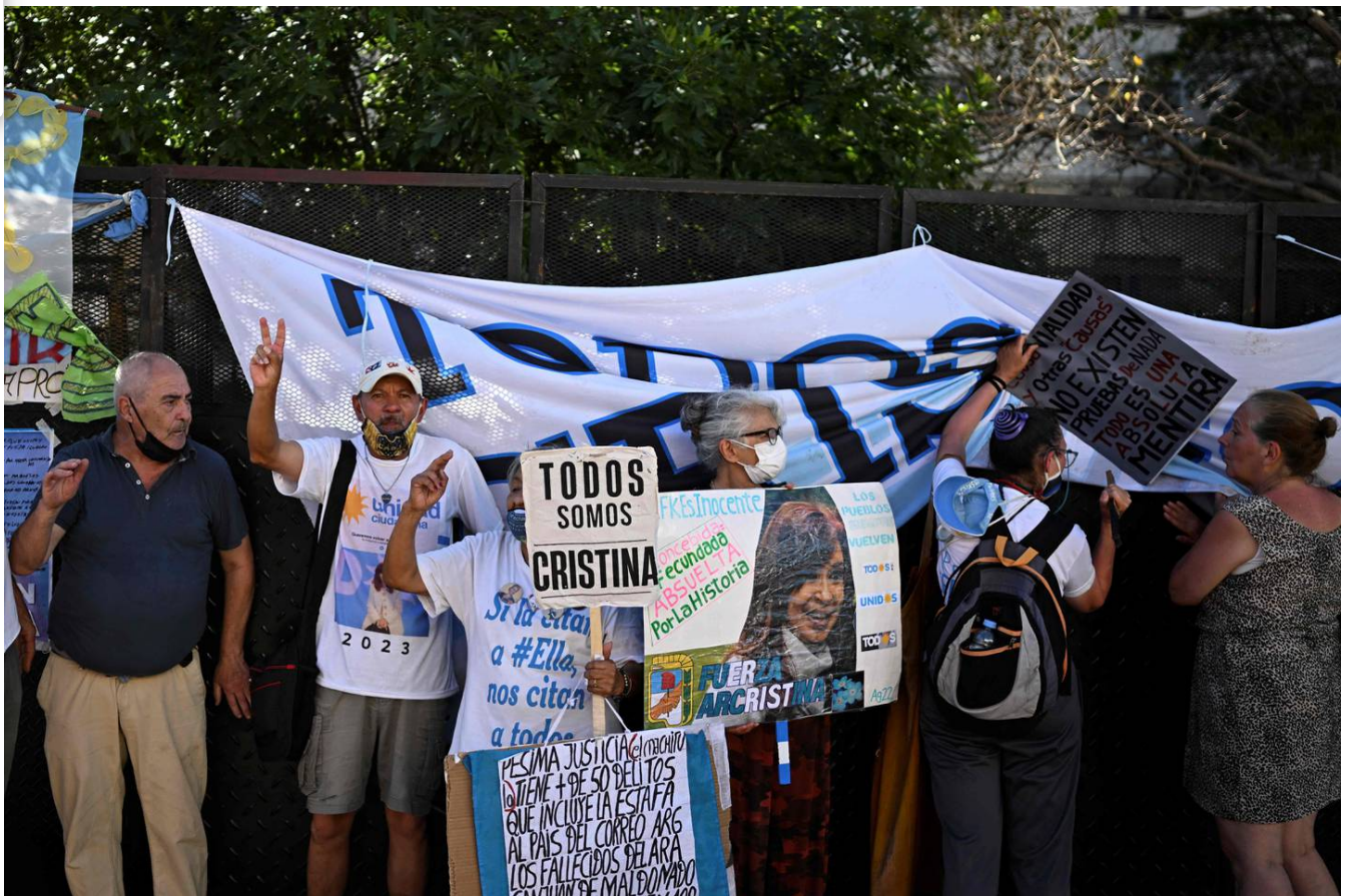
La vicepresidenta desalentó las movilizaciones para evitar provocaciones, pero siempre llegó alguna gente.

“No voy a ser candidata a nada, ni a senadora, ni a diputada, ni a presidenta de la nación”, dijo Kirchner en un mensaje por las redes sociales.