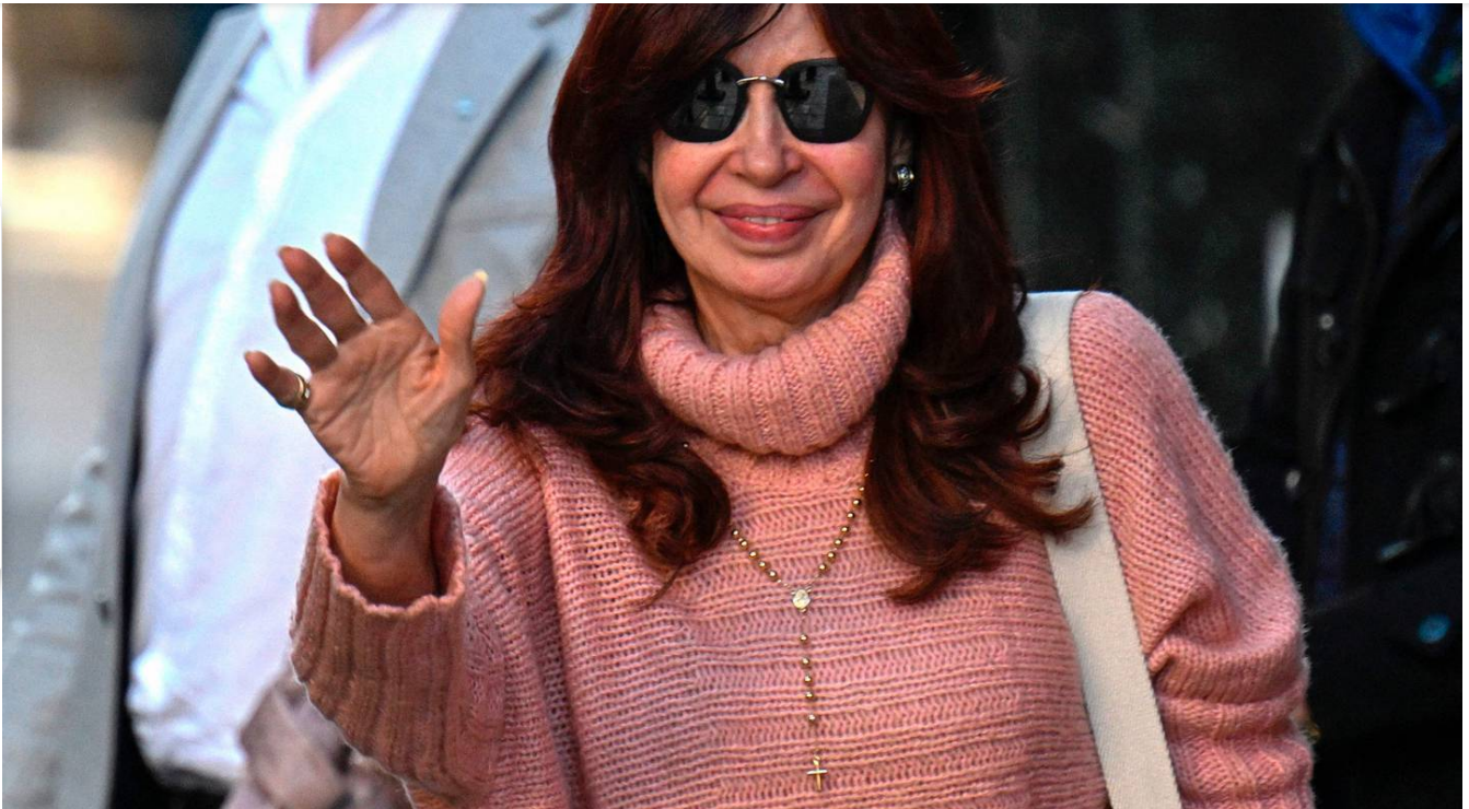
Fernández no podrá volver a ejercer cargos públicos.

Kirchner, de 69 años, fue hallada culpable de “administración fraudulenta” en perjuicio del Estado en el otorgamiento de obras viales en la provincia de Santa Cruz, de donde es originaria.