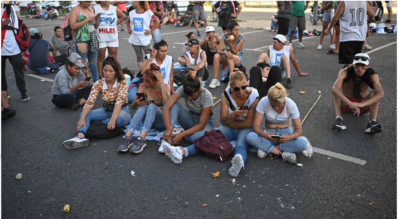
La gente llegó a los tribunales aunque ella escuchó la sentencia de forma virtual.