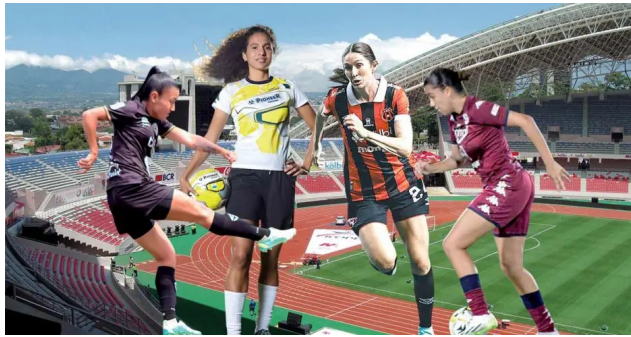
Costa Rica tiene mujeres capacitadas para liderar el fútbol femenino e iniciar el proceso de profesionalización.

Walter Herrera wherrera@larepublica.net | viernes 16 febrero, 2024