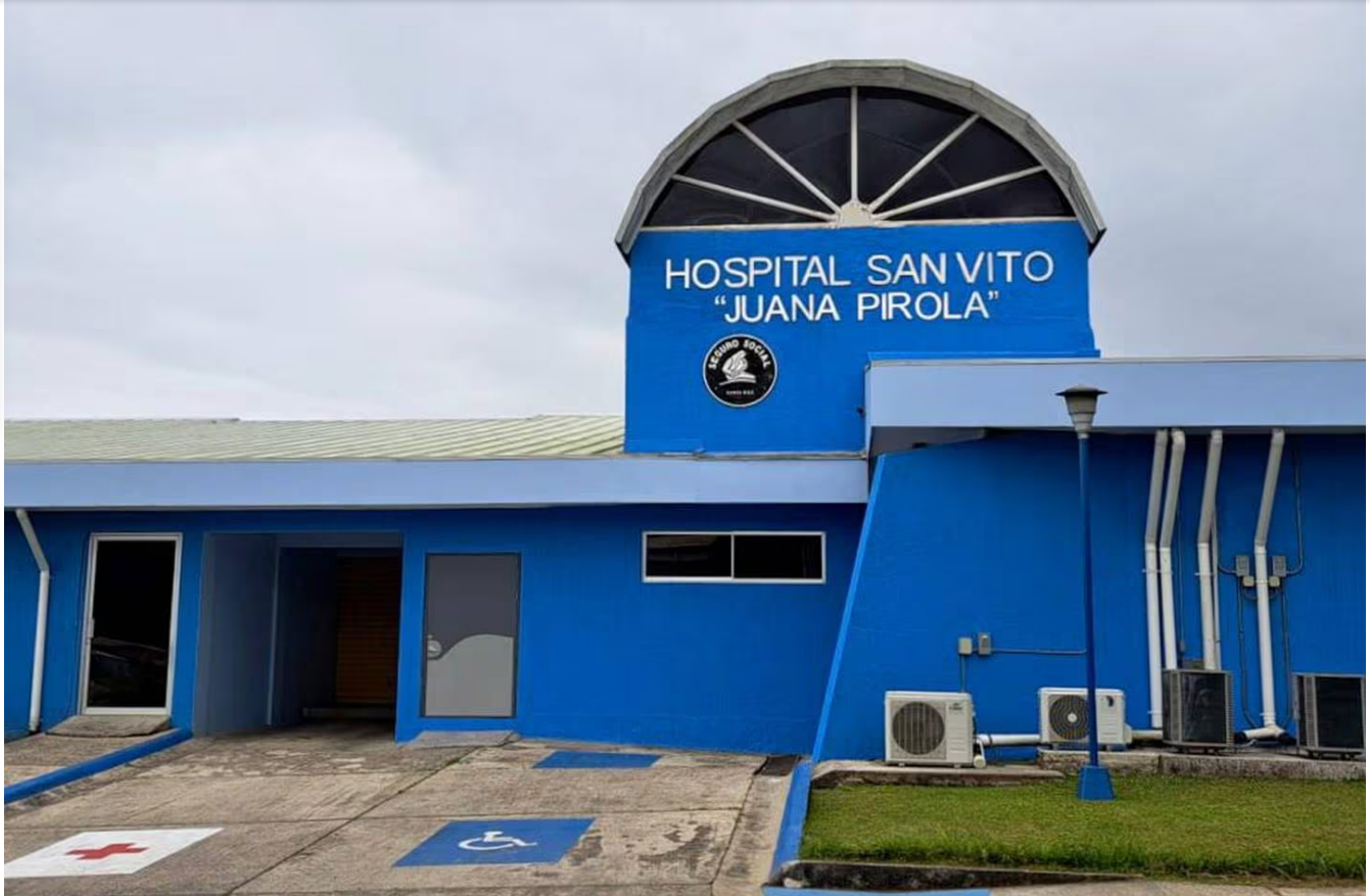
Así quedó la fachada del hospital.