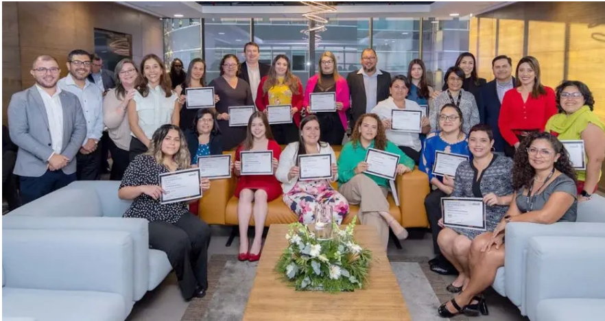
Las participantes adquieren una certificación como practicantes en la nube de AWS (Certified Cloud Practitioner Certification), credencial clave que evidencia sus habilidades y es reconocida por la industria a nivel mundial.

Brenda Camarillo bcamarillo@larepublica.net | Martes 13 diciembre, 2022