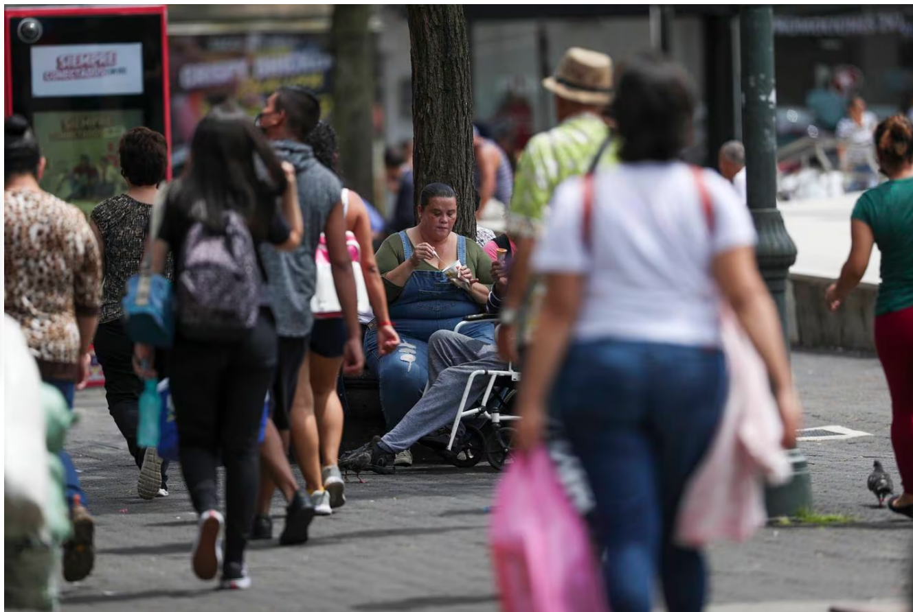
Costa Rica llegó a cinco millones de habitantes en 2018, y probablemente no llegue a los seis millones. (Jose Cordero)