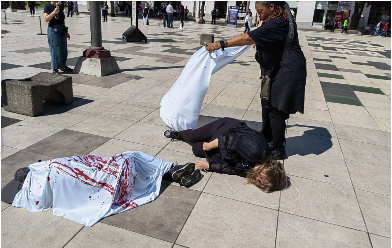
Protesta pide eliminar la violencia contra las mujeres.

El Colectivo Mujeres por la Vida llenó de muerte la Plaza de la Cultura en San José centro.