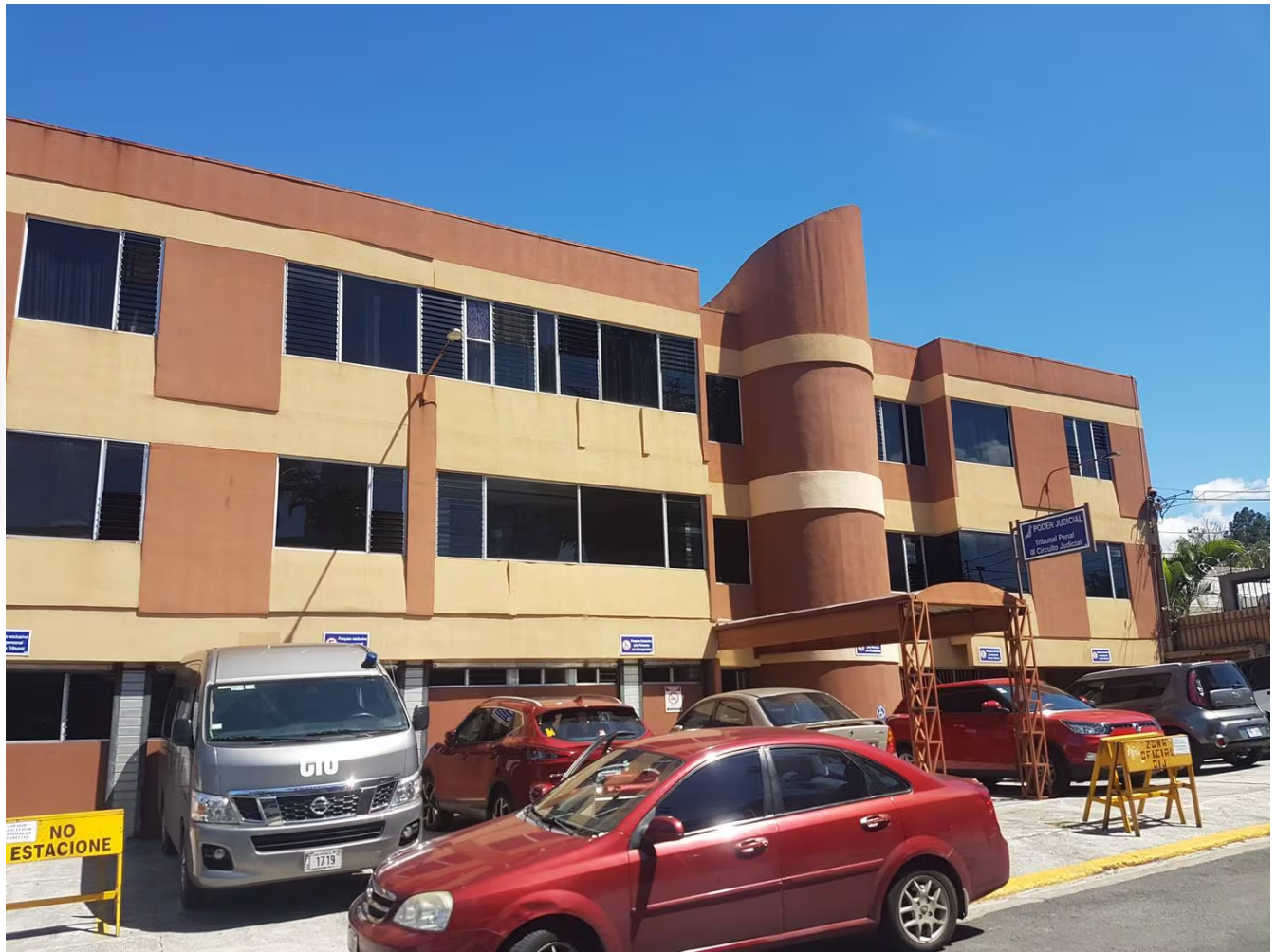
La primera sentencia contra el expolicía fue dictada en el Tribunal Penal de Pavas.