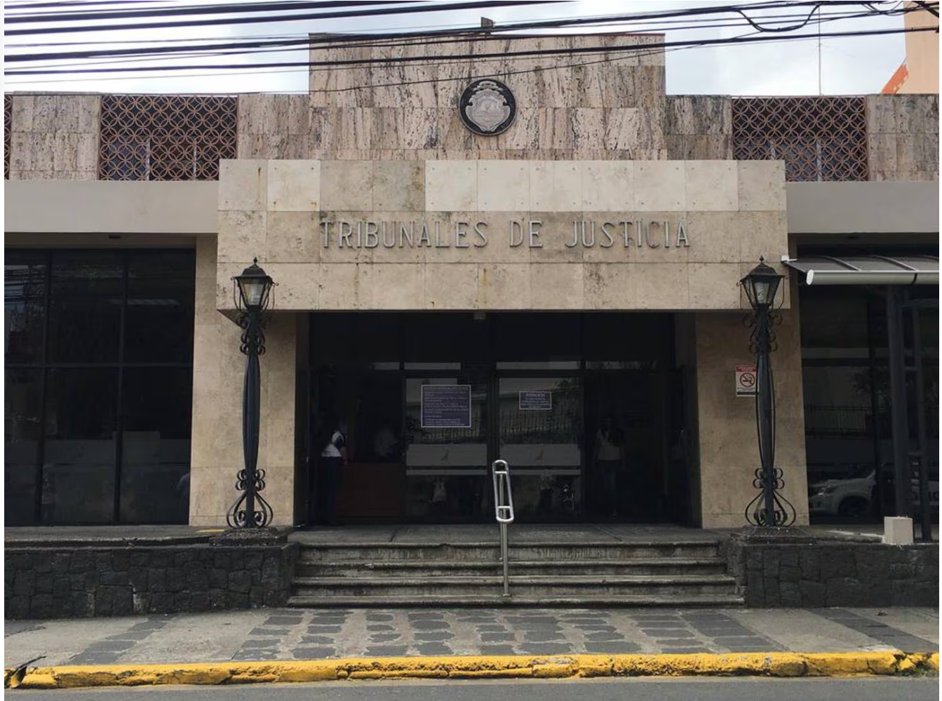
La pena fue dictada en el Tribunal Penal de Heredia.

Chaves Saborío debe permanecer en prisión preventiva, a la espera de que la condena adquiera firmeza.