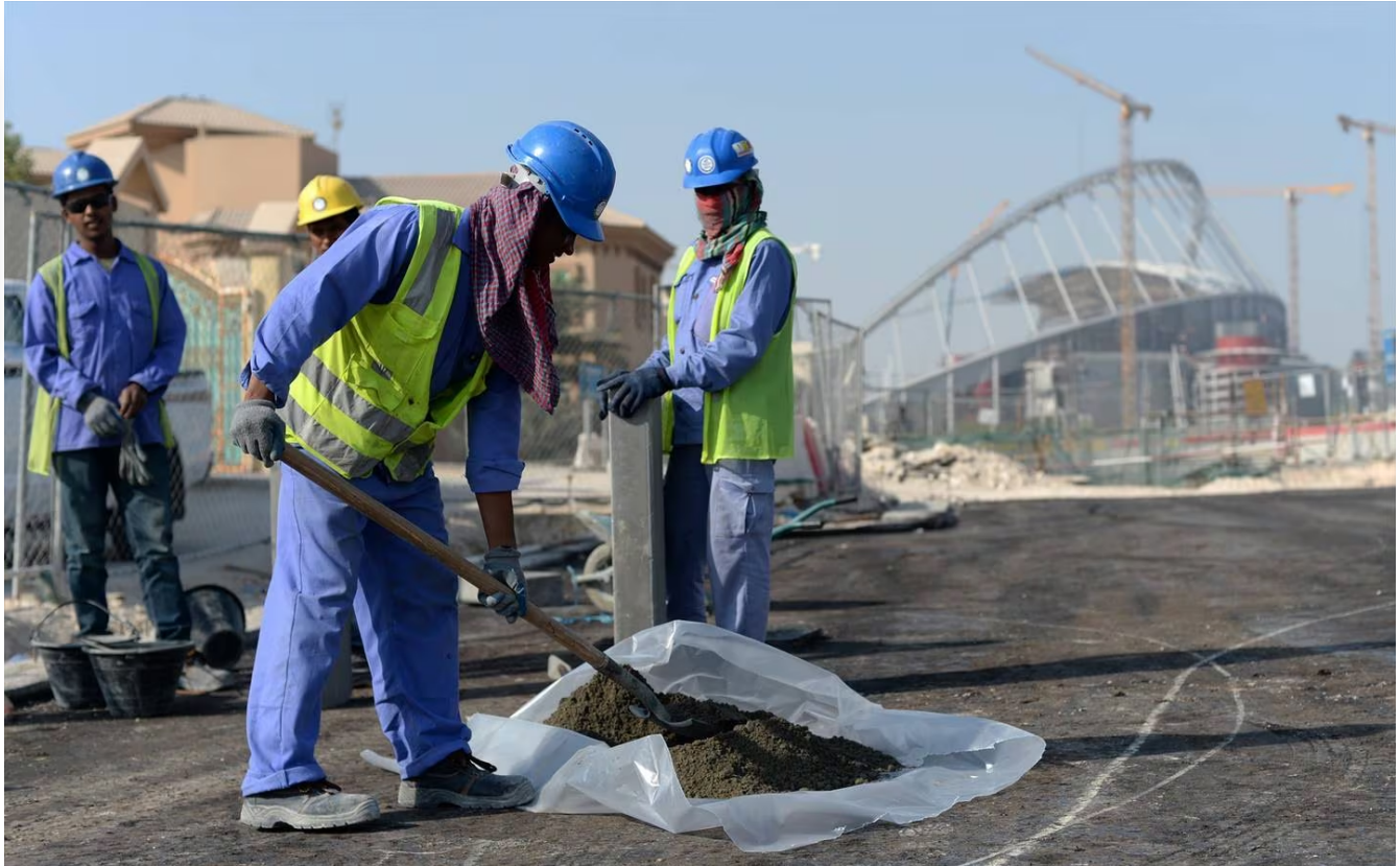
Según un reportaje del diario británico "The Guardian", unos 6.500 trabajadores murieron de agotamiento durante la construcción de las obras para el Mundial de Fútbol en Catar.

LEA MÁS: Shakira también podría negarse a cantar en Mundial de Qatar 2022