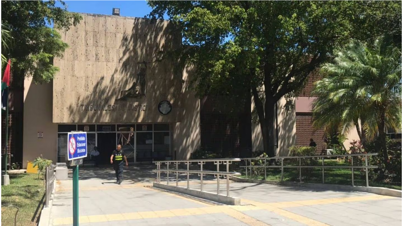
Caso de violación y abuso sexual tuvo que ir a un juicio de reenvío en Liberia, Guanacaste.

“De esa manera, por segunda ocasión, el Tribunal de Juicio de Liberia, con una integración distinta, dio plena credibilidad a los hechos acusados por la Fiscalía y condenó al imputado”, indicó el Ministerio Público en un comunicado.