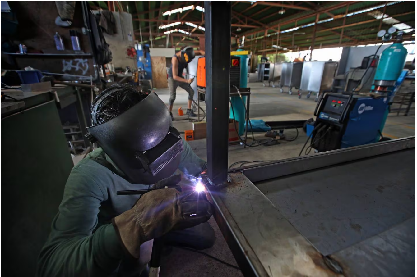
El 57% de las personas ocupadas en el sector construcción carece de un seguro de salud por trabajo, de acuerdo con la última Encuesta Continua de Empleo. Imagen con fines ilustrativos.