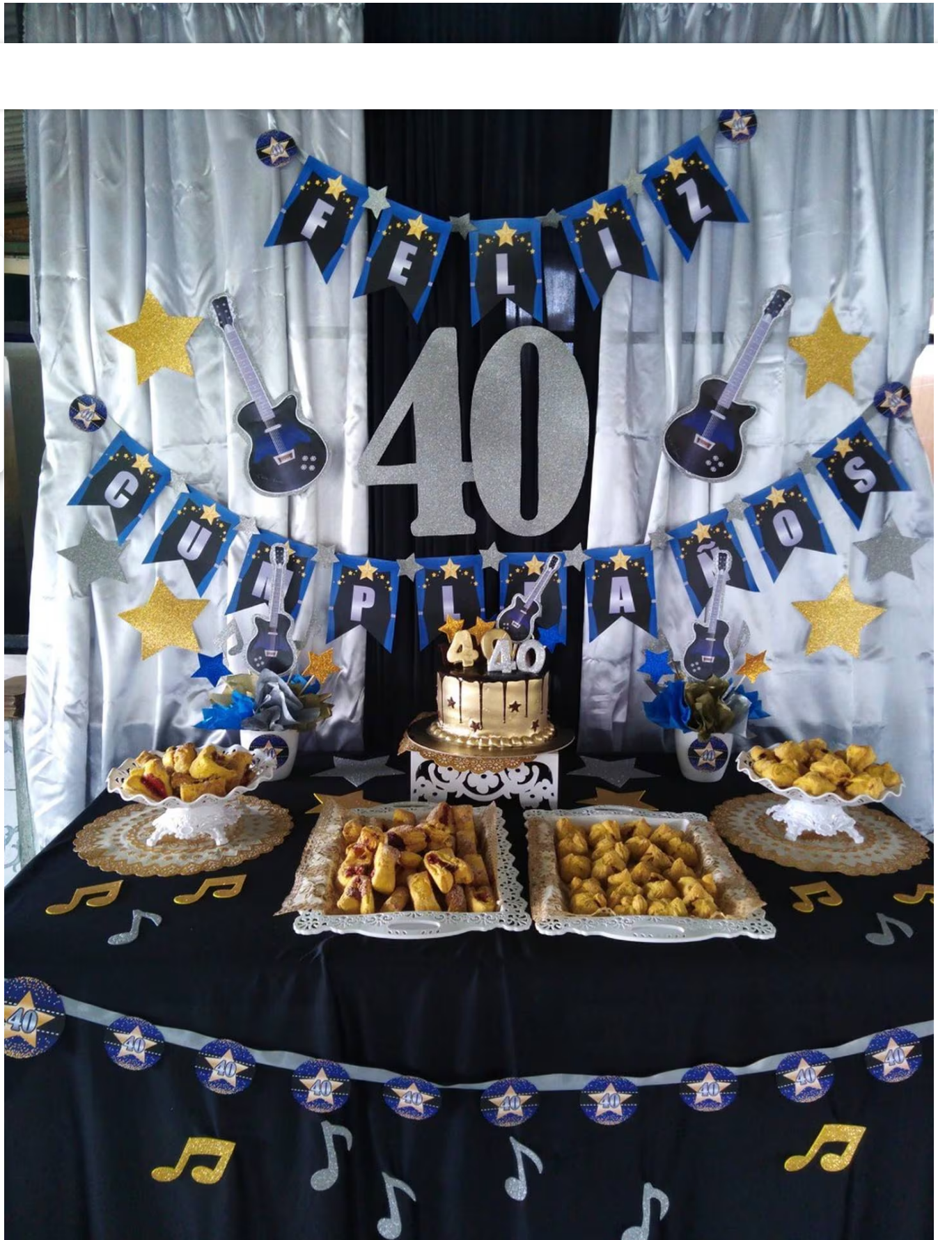
Greilyn Arley hace artículos de fiesta personalizados.