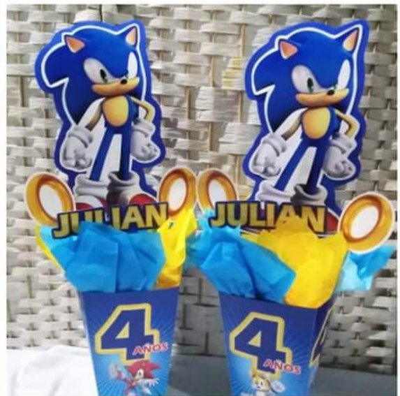
Los niños se sienten realizados a vivir una fiesta personalizada.