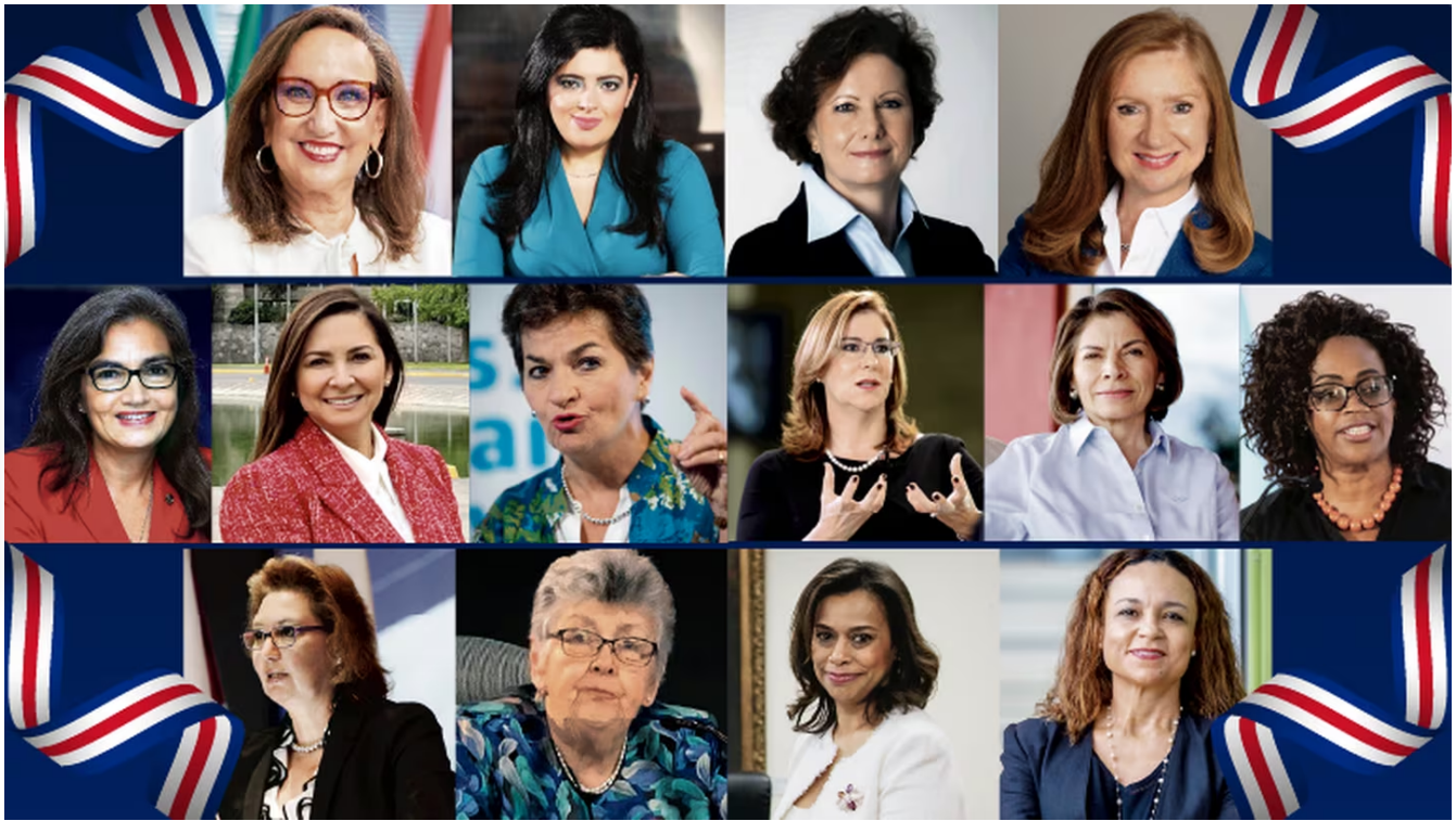
Mujeres costarricenses en altos cargos internacionales.

Al menos 14 mujeres costarricenses han alcanzado altos puestos internacionales en la política, la justicia y la ciencia, dando testimonio de que es posible romper las barreras de acceso , unas sociales y otras políticas.