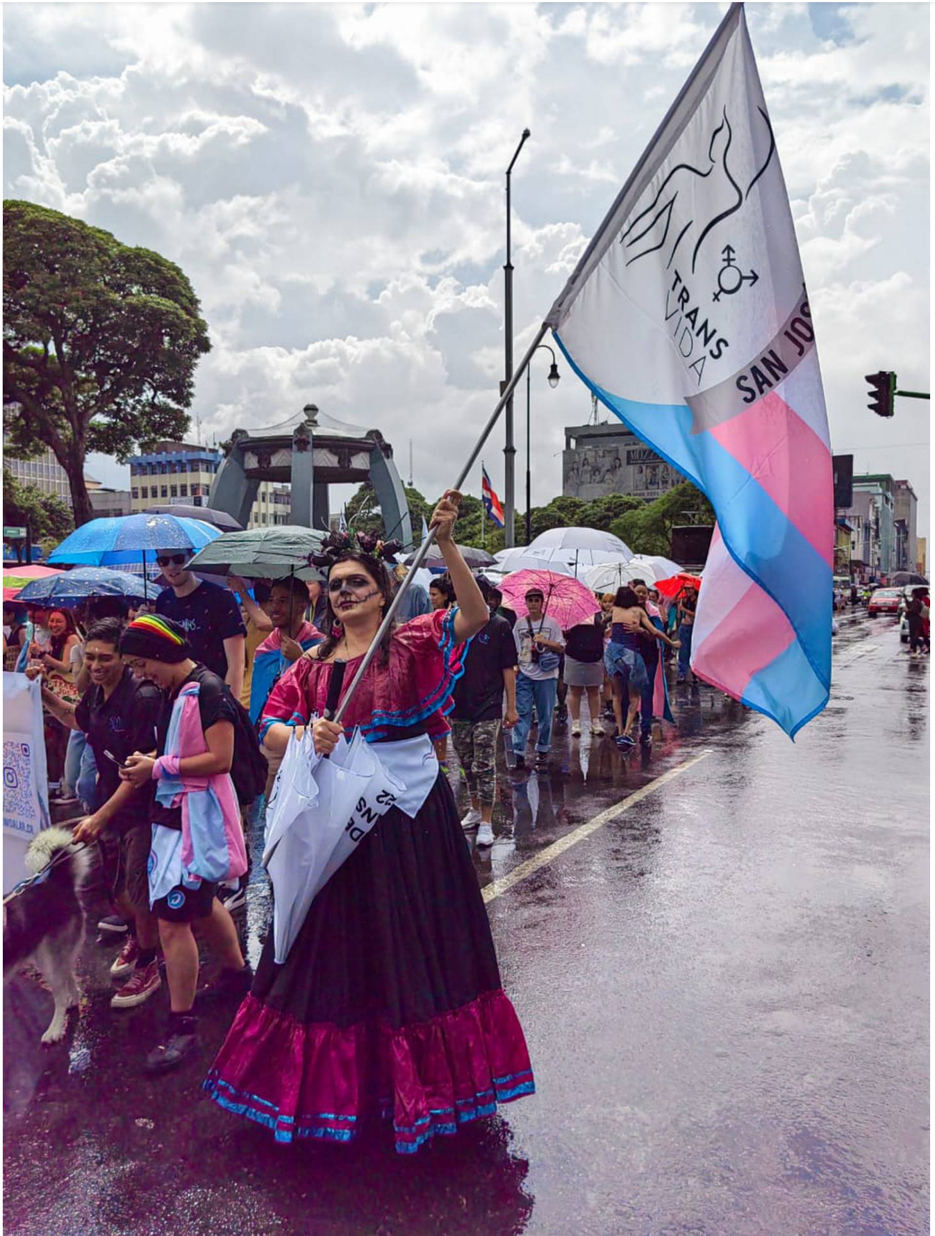
La primera Marcha del Orgullo Trans 2022 se realizó este 16 de octubre en San José. (Eduardo Vega Arguijo)