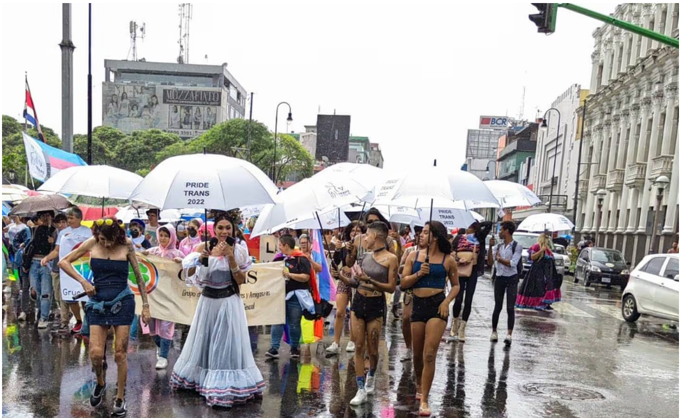
La marcha arrancó en el Parque Central de San José. (Eduardo Vega Arguijo)

"Las personas trans mayores de 40 años son consideradas sobrevivientes, porque el promedio de vida de esta comunidad, en América Latina y el Caribe, es de 35 a 40 años, ya que a lo largo de su vida sufren todo tipo de agresiones y no logran recibir los servicios de salud que necesitan", explica la Red Latinoamericana y del Caribe de personas trans (Lactrans).