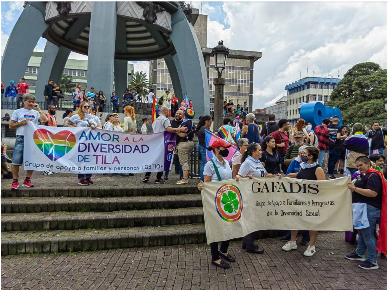
Diferentes organizaciones que defienden los derechos de la comunidad trans apoyaron la marcha. (Eduardo Vega Arguijo)

Hablamos de unas 200 personas de esta comunidad; además de organizaciones que les apoyan y familiares que se hicieron presentes en esta Marcha del Orgullo Trans. Eso es más del doble de lo que llegó a la primera Marcha del Orgullo LGBTQ+ en el 2003. Hubo representantes trans de Puntarenas, Limón, Guanacaste y las restantes provincias.