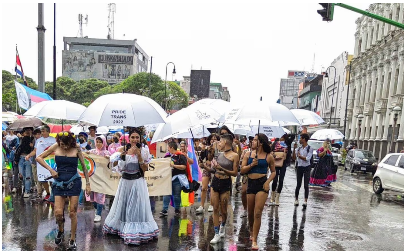
La marcha arrancó en el Parque Central de San José.

“Las personas trans mayores de 40 años son consideradas sobrevivientes, porque el promedio de vida de esta comunidad, en América Latina y el Caribe, es de 35 a 40 años, ya que a lo largo de su vida sufren todo tipo de agresiones y no logran recibir los servicios de salud que necesitan”, explica la Red Latinoamericana y del Caribe de personas trans (Lactrans).