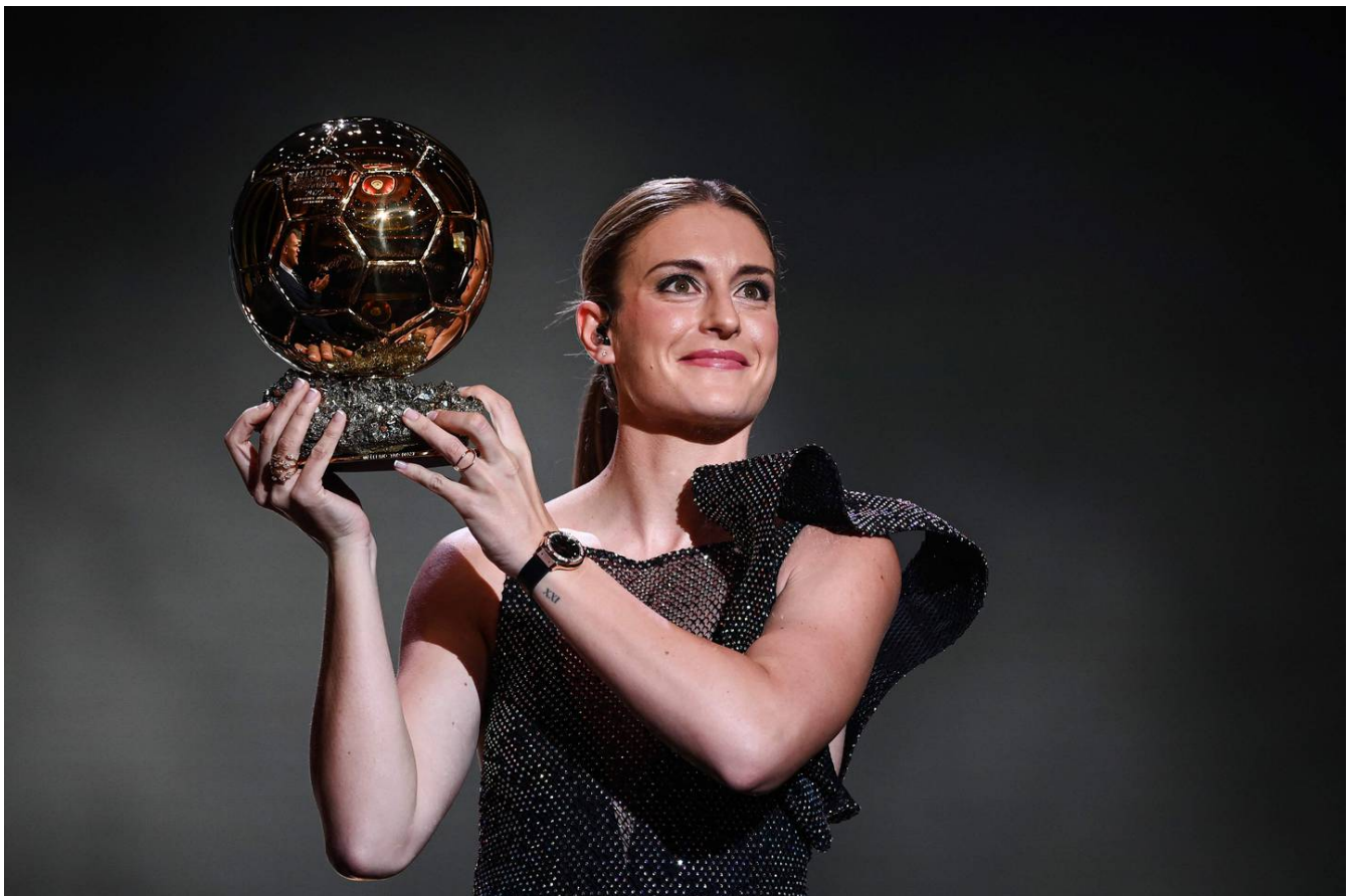
Alexia Putellas muestra orgullosa su Balón de Oro.

Pero ' Alexia ', como figura en su camiseta, ha revolucionado tanto el fútbol femenino español y europeo estas últimas temporadas que incluso sin la Eurocopa en su palmarés, los votos la han elegido por encima de su gran rival, la inglesa Beth Mead , ganadora del título europeo "en casa".