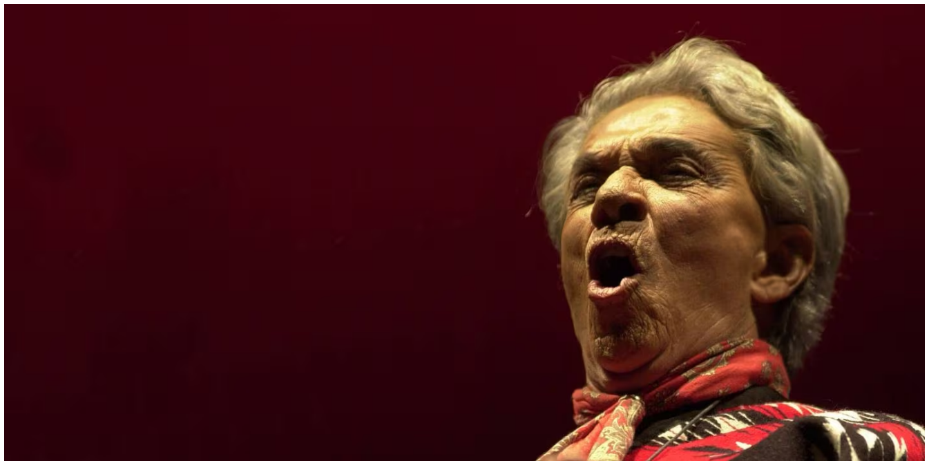
Chavela Vargas durante un homenaje en el Teatro de la Ciudad de México en el 2009.

La cantante Isabel Vargas Lizano, conocida como Chavela Vargas, fue declarada benemérita de las artes patrias este jueves por la Asamblea Legislativa, diez años después de su muerte.