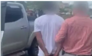
El sujeto se mantuvo en fuga por 19 días.

Los casos que se le imputan ocurrieron entre julio del 2020 y enero del 2021.