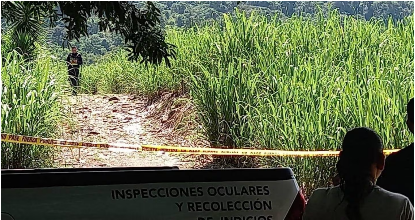
El cuerpo fue hallado en un cañal de Pejibaye de Jiménez, Cartago.

La alerta de este caso se generó el mismo día del crimen, cuando un vecino informó sobre una mujer herida en un cañal. Las autoridades y la Cruz Roja intervinieron, confirmando los socorristas que la paciente estaba sin vida. Posteriormente, oficiales de la Fuerza Pública llevaron a cabo un operativo en los alrededores y lograron la detención del acusado.