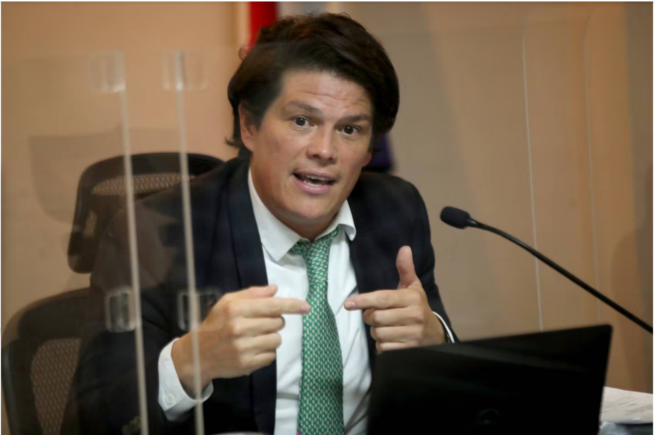
Los jueces justificaron las razones de la condena.

El tribunal detalló que las muchachas en sus testimonios narraron que cruzaban las piernas cuando iban con él en el carro para que no pudiera tocar sus partes íntimas y que cuando les ponía el aceite de los masajes se agarraban la ropa como manera de resistencia.