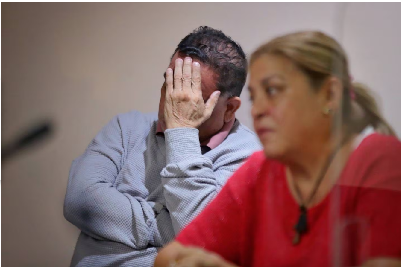
Así escuchó la sentencia el entrenador de boxeo.

Para los jueces no hubo duda que entre los años 2019 y 2021, mientras era entrenador de boxeo , les decía a las menores de entre 12 y 15 años que tenía que echarles aceite mineral para bajar de peso.