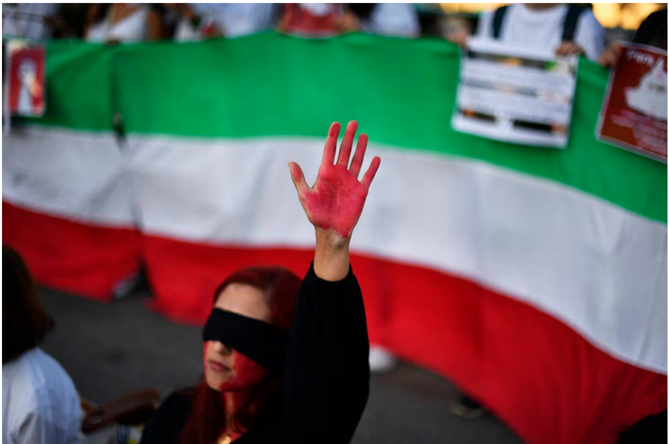
Según informes, al menos 92 personas murieron desde el 16 de setiembre en las protestas.

Desde el inicio de la protesta, el régimen detuvo a conocidos partidarios del movimiento e impuso severas restricciones al acceso a las redes sociales. Irán acusa reiteradamente a fuerzas externas de avivar las protestas, en particular a Estados Unidos, su enemigo jurado.