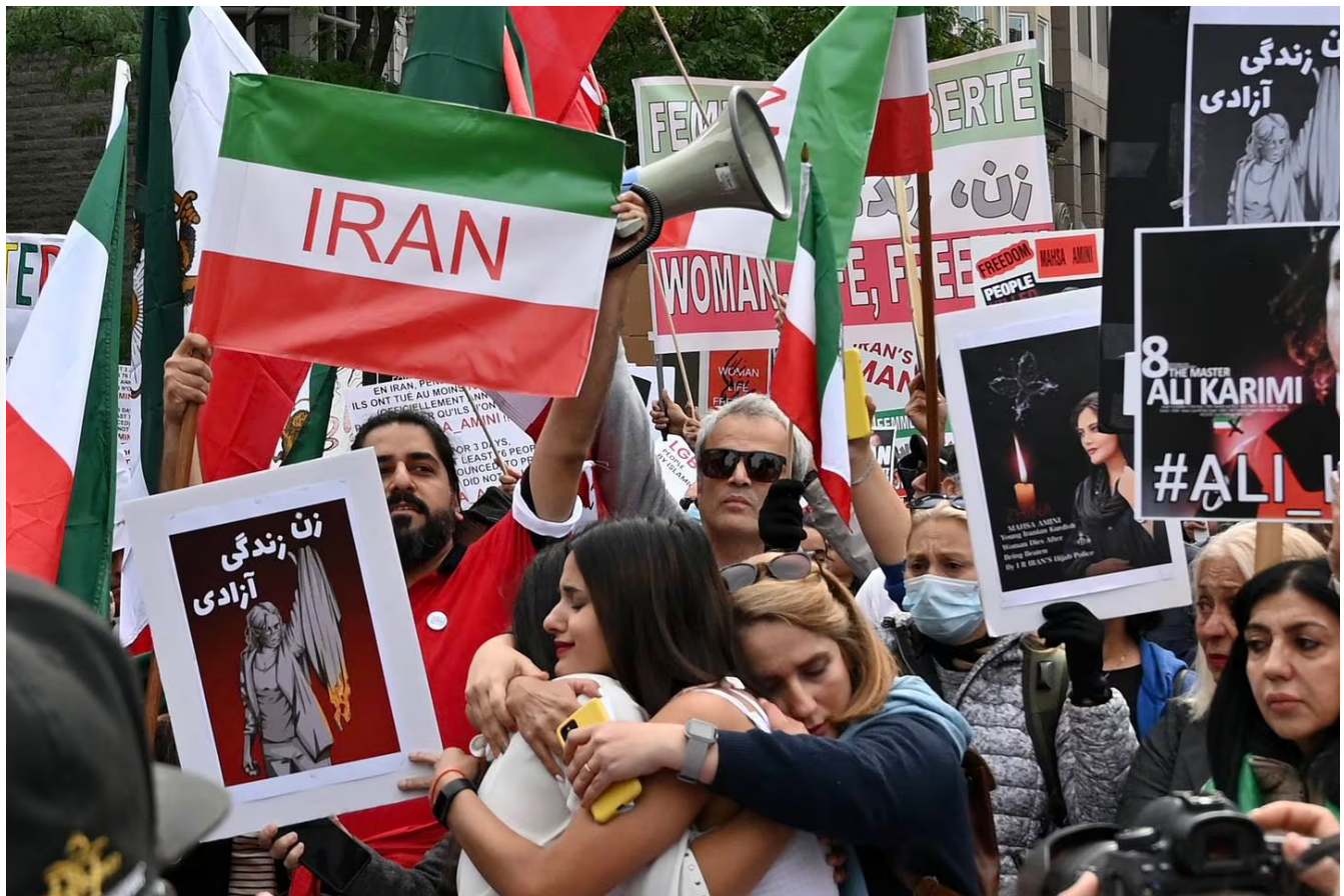
Las manifestaciones, las más importantes en Irán desde las del 2019, fueron reprimidas con sangre.