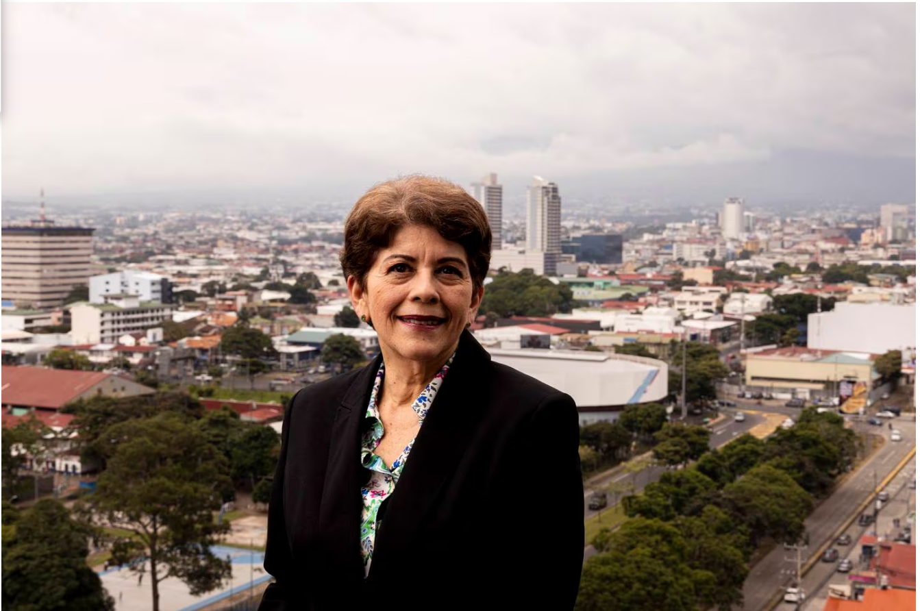
Doña Marta Acosta tiene cuatro gobiernos de diferentes colores políticos de ser contralora.

“El Movimiento Mujeres por la Dignidad y la Democracia del Foro Político de Mujeres y otras mujeres preocupadas ante las amenazas a la estabilidad democrática, manifestamos nuestro firme respaldo a la señora Contralora General de la República, Marta Acosta, en su esfuerzo justificado y valeroso por defender a la CGR de las presiones y desinformación provenientes de altos representantes del gobierno y de sus diputados y diputadas.