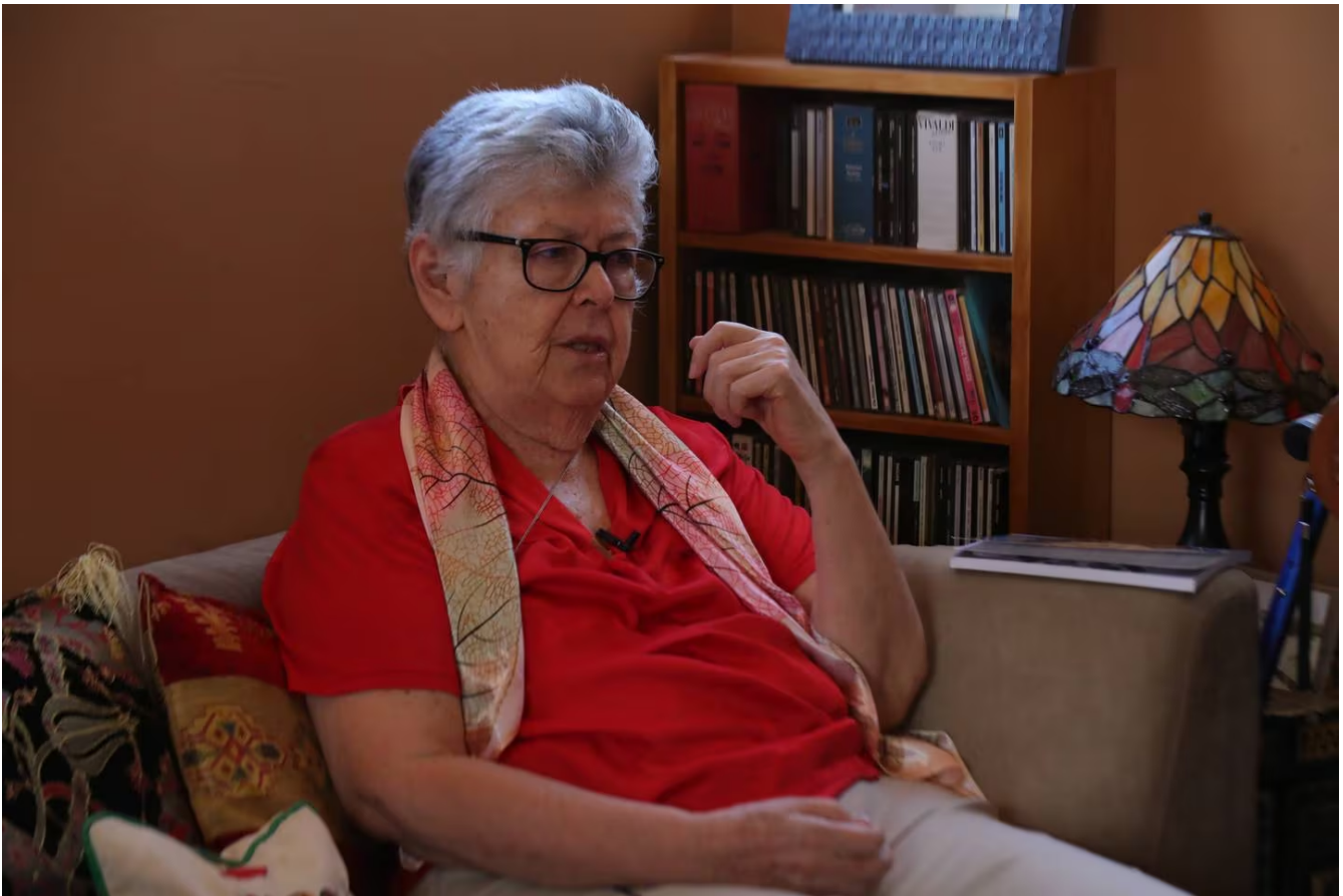
Elizabeth Odio Benito, exvicepresidenta de la República entre 1998 y 2002.