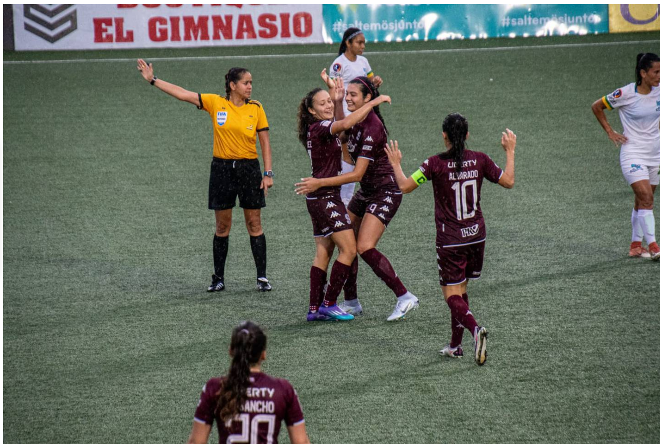
Saprissa FF consiguió su segunda victoria en el Torneo Interclubes de Uncaf.

Saprissa FF cosechó su segundo triunfo en el Torneo Interclubes de Uncaf y esta vez lo hizo por 4 a 2 contra Somotillo de Nicaragua.