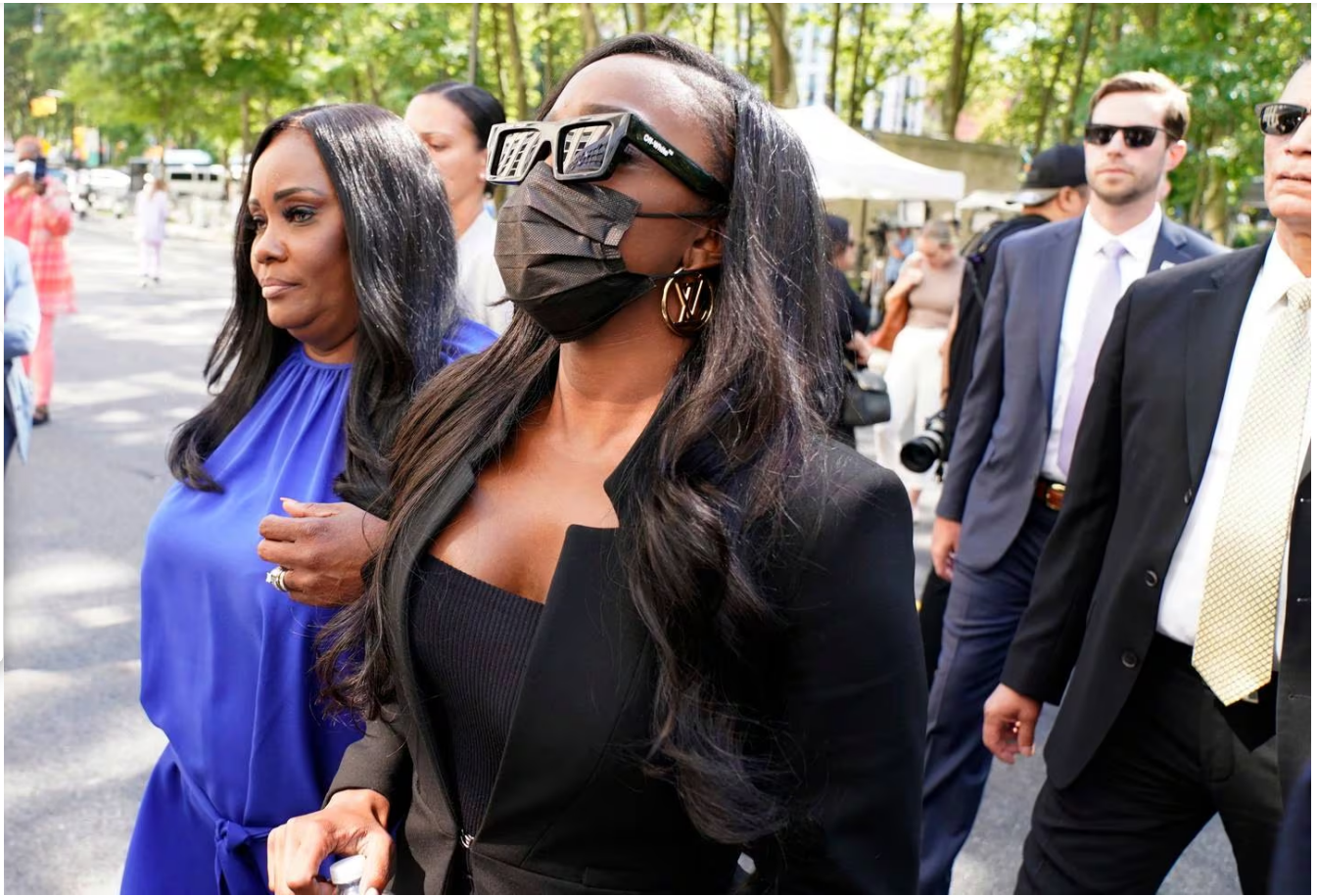
Algunas de las víctimas del cantante declararon los supuestos abusos que sufrieron.

El jurado de 12 personas demoró unas 11 horas para llegar a un veredicto, que podría sumar una fuerte condena a los 30 años de encarcelamiento que ya recibió el cantante en Nueva York en septiembre por reclutar a adolescentes y mujeres para practicar sexo.