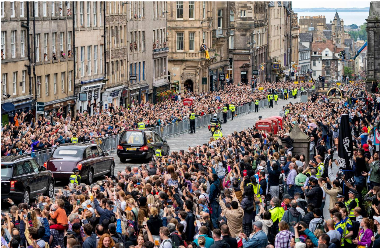
Miles de personas observan el coche fúnebre que lleva el ataúd de la reina Isabel II, envuelto en el estandarte real de Escocia, mientras se conduce desde el castillo de Balmoral hacia el palacio de Holyroodhouse.