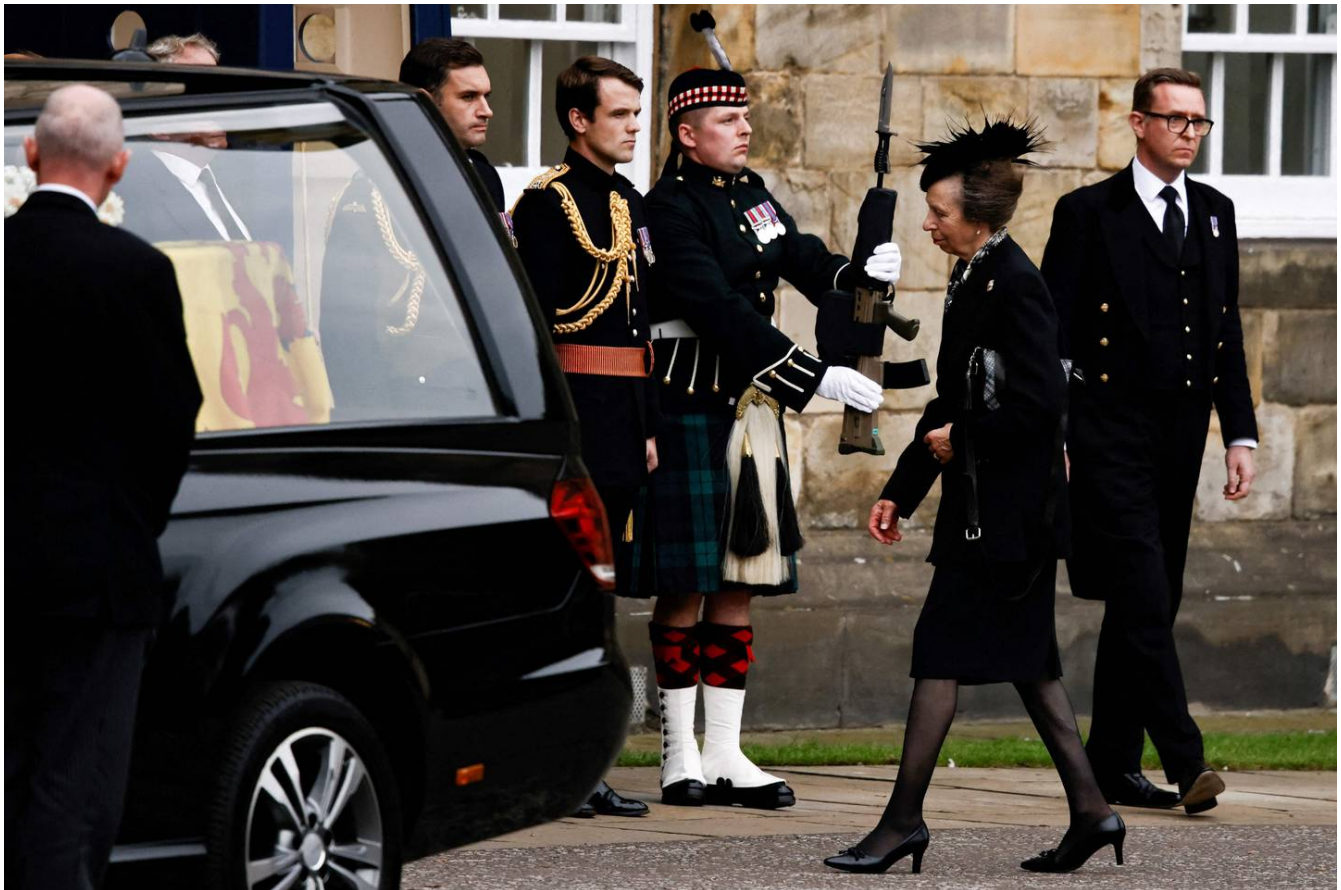
La princesa Ana, hija de la reina Isabel II, acompañó el cortejo para llevar los restos de su madre hasta Edimburgo.