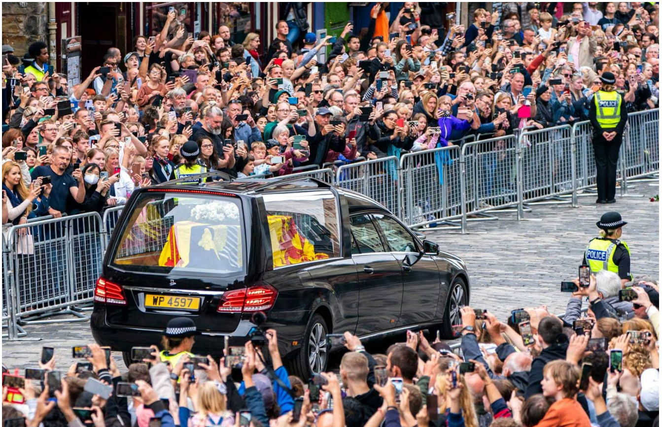
El recorrido de Balmoral a Edimburgo por carretera tardó aproximadamente seis horas.