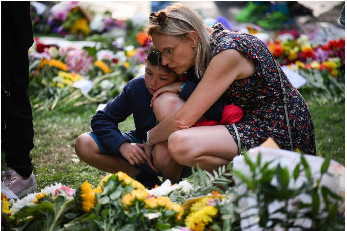
Los londinenses se han mostrado conmovidos por la partida de quien fuera su soberana por 70 años.