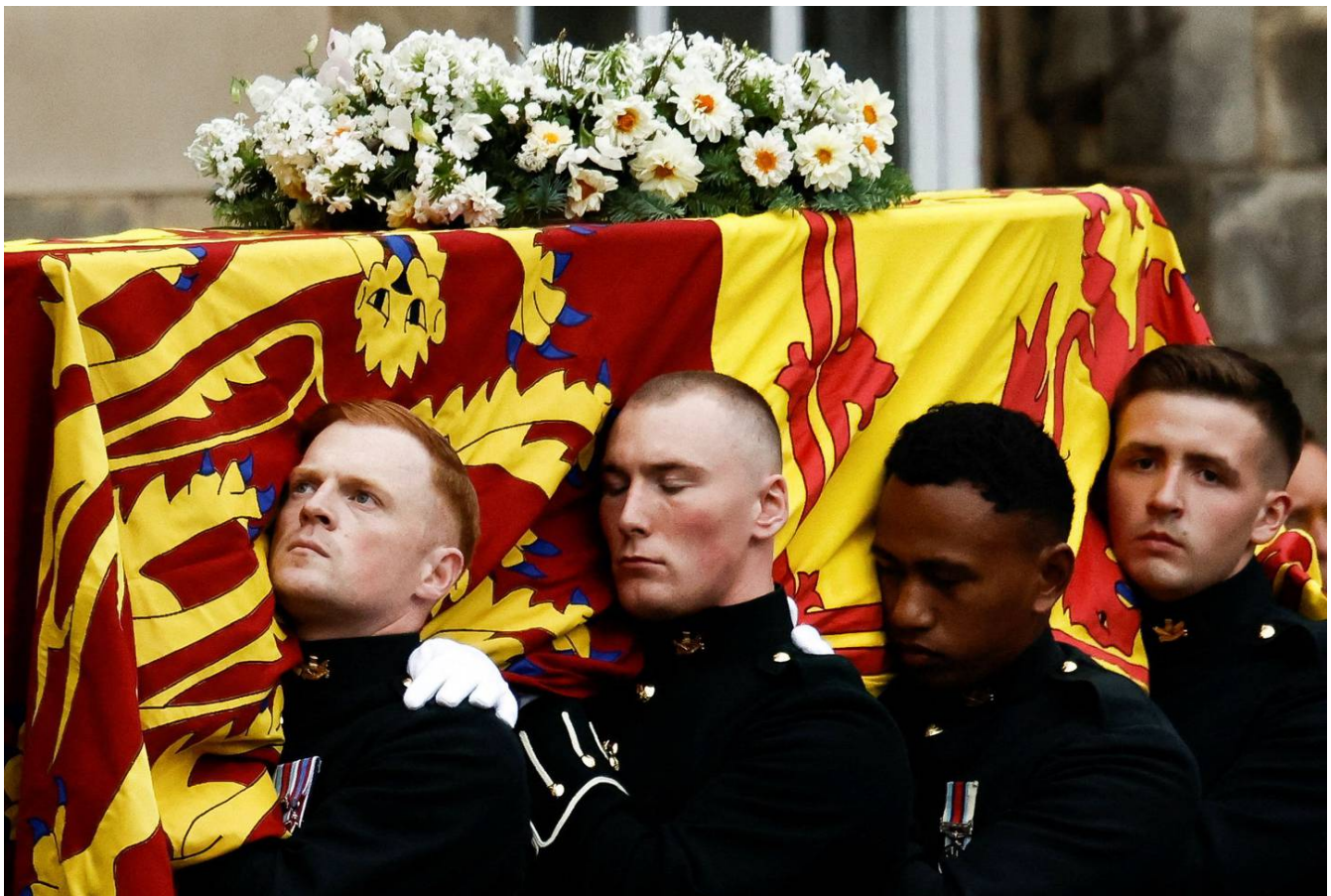
Con gran respeto fue cargado el féretro de la reina Isabel II durante su traslado de Aberdeenshire a Edimburgo.

A continuación les dejamos imágenes del cortejo.