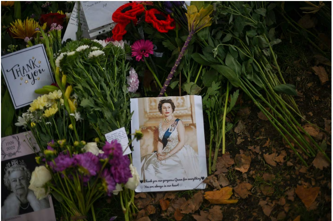
Entre los tributos y homenajes que han realizado los súbditos de Isabel II tras su muerte, hay muchas fotos de la fallecida reina cuando era joven.