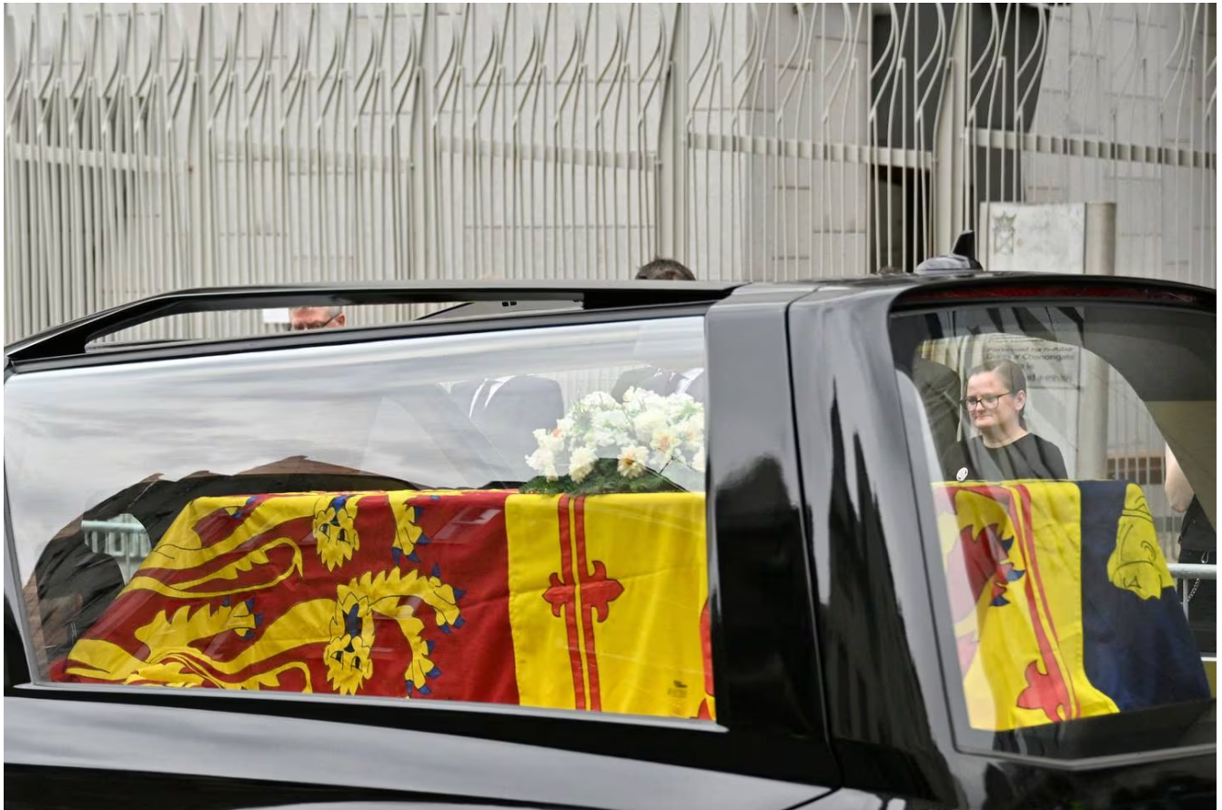
El ataúd que lleva el cuerpo de la reina Isabel II dejó su amado castillo de Balmoral el 11 de setiembre de 2022.