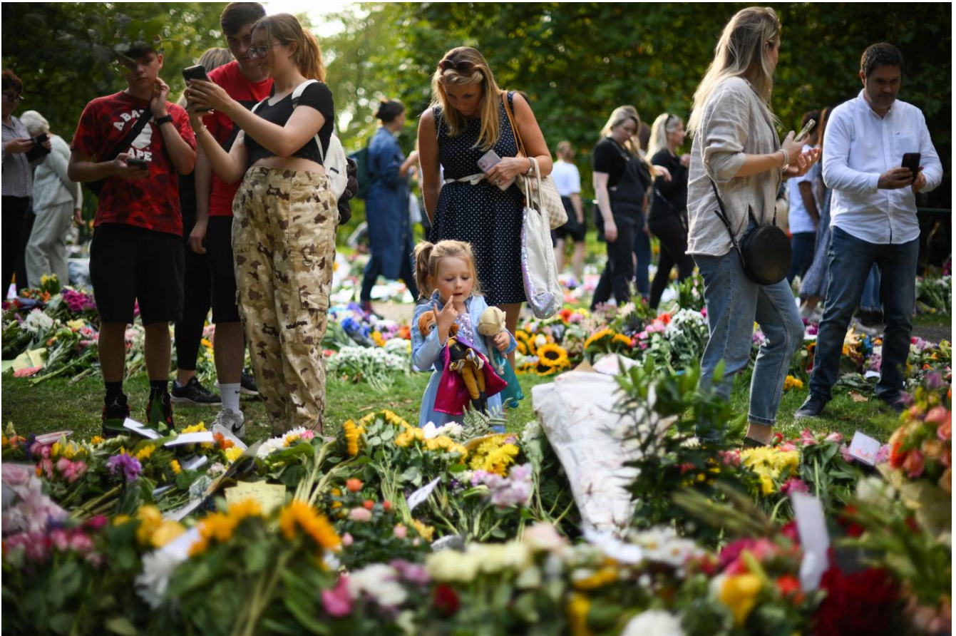
Una niña mira las flores colocadas por simpatizantes en memoria de la reina Isabel II de Gran Bretaña en Green Park, cerca del Palacio de Buckingham.