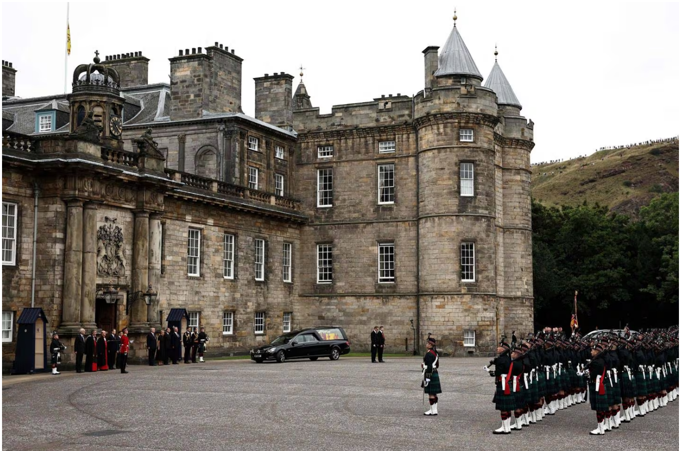
Llegada del coche fúnebre que lleva el ataúd de la difunta reina Isabel II, cubierto con el estandarte real de Escocia, al Palacio de Holyroodhouse, en Edimburgo.