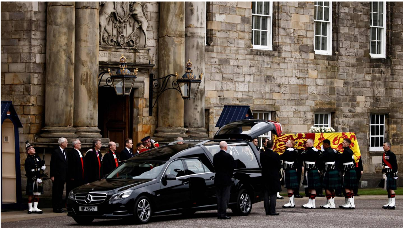
El féretro de la reina Isabel II fue cubierto por el estandarte real de Escocia.