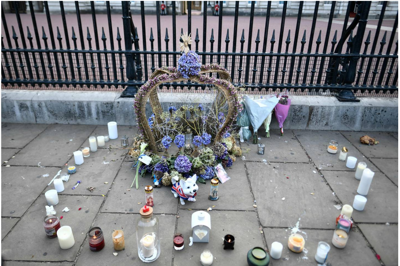
Las velas se colocan alrededor de una corona de flores para presentar sus respetos a la reina Isabel II de Gran Bretaña en las afueras del Palacio de Buckingham, en Londres.