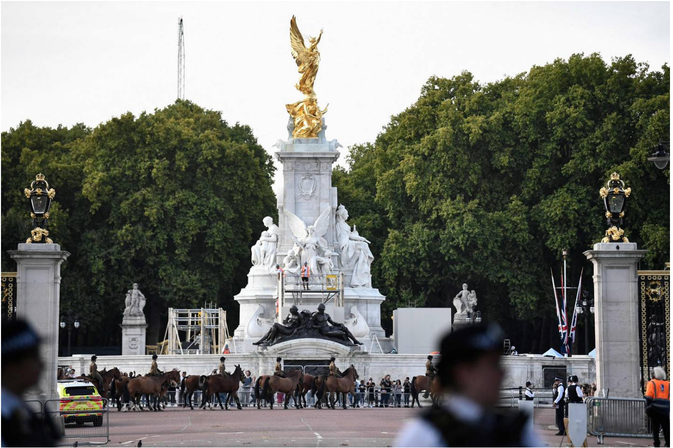
Varios trabajadores se apuraron para terminar los preparativos en las afueras del palacio de Buckingham y tener todo listo para recibir el féretro de la reina Isabel II.