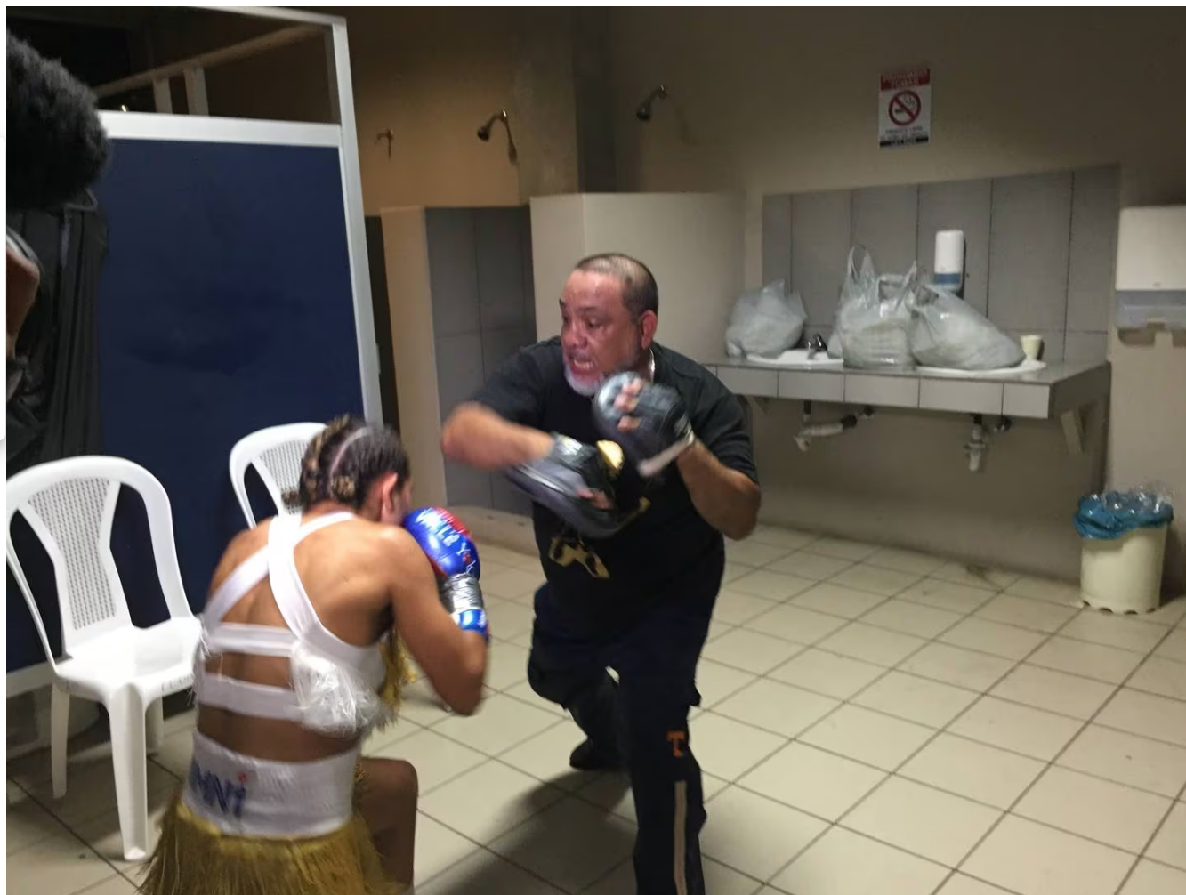
La joven entrenó en el 2019, pero dejó de entrenar en el 2021, pese a su sueño de ser como Yokasta Valle.