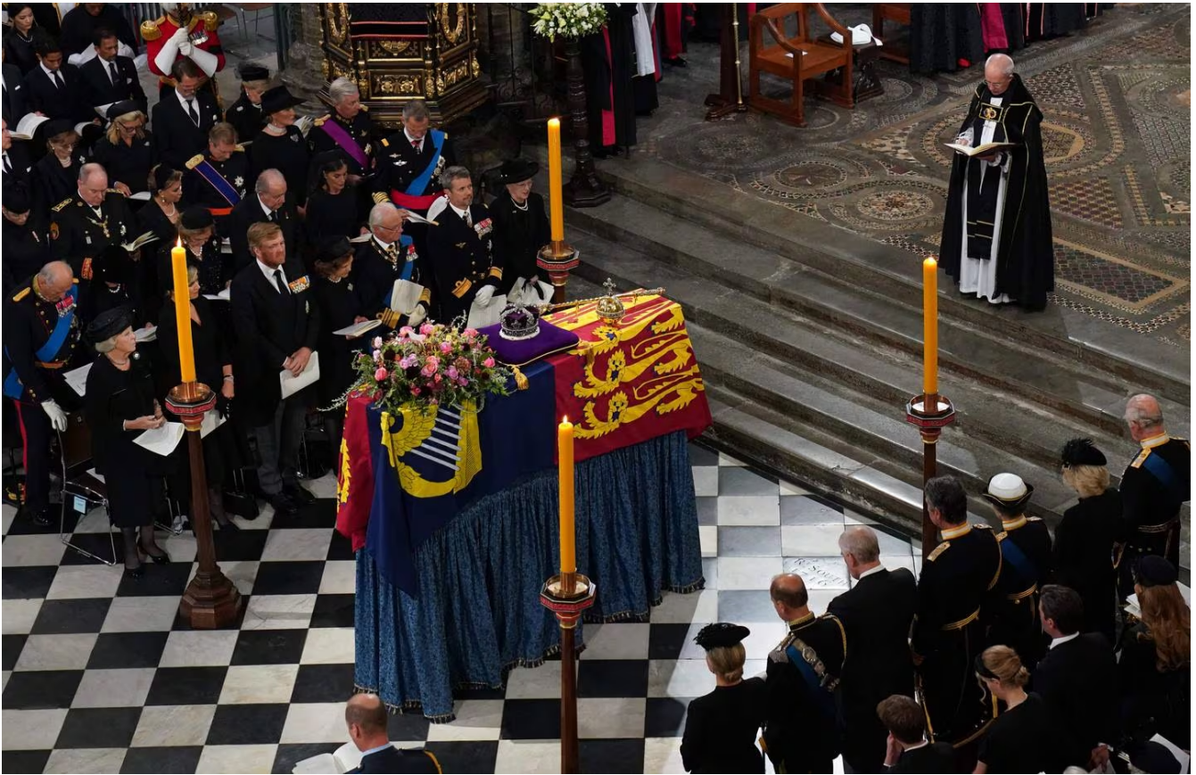
El arzobispo de Canterbury, Justin Welby, hablando durante la homilía del funeral de la reina Isabel II.

poder y los privilegios son olvidados”, afirmó Welby.