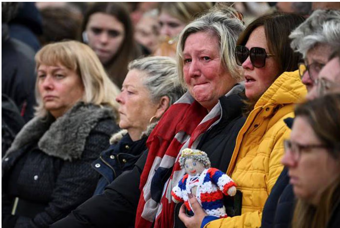
Una conmoción absoluta en torno al último adiós de la reina Isabel II.