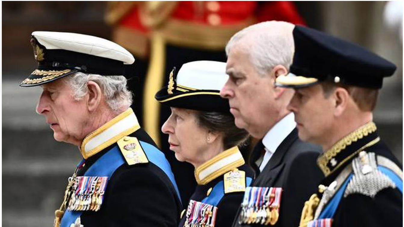
El rey Carlos, la Princesa Ana y el Príncipe Andrés se mostraron consternados.