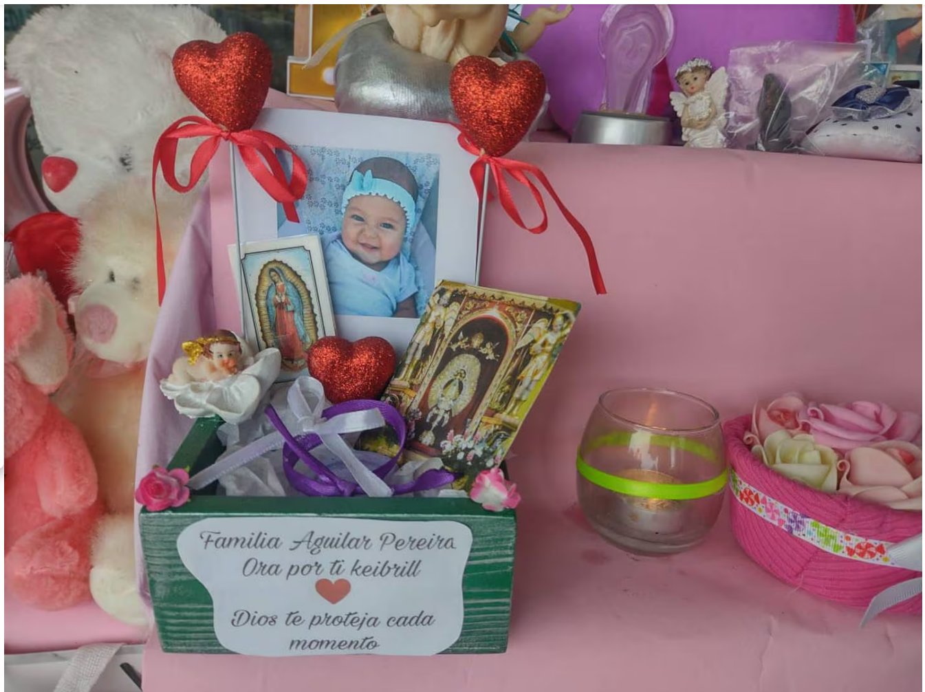
La familia y vecinos de Keibril la buscaron por todo lado, pero nunca pareció.

Navas dice que es urgente crear castigos más serios para estos casos tan particulares y dolorosos.