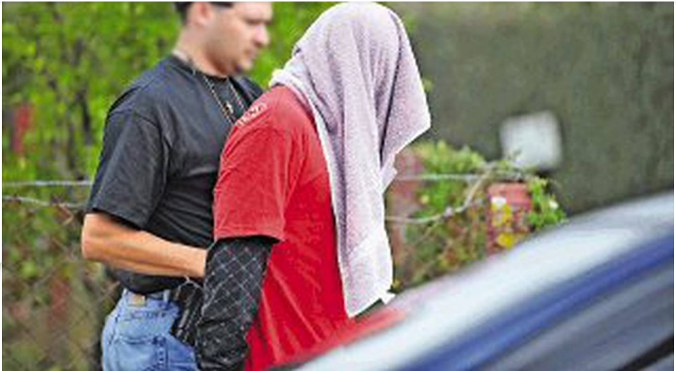
Los responsables del crimen pagaron con cárcel.