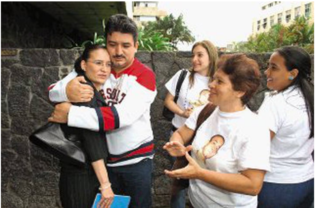
La lucha de esta mamá se convirtió en la lucha de muchas familias unidas por un mismo dolor.

“Del otro condenado sé que ya salió porque hace como un año me vinieron a hacer una entrevista porque le iban a dar el beneficio, él no puede acercarse a mí, ni a mi familia, ni estar cerca de aquí, pero uno sabe que eso no se cumple”, dijo.