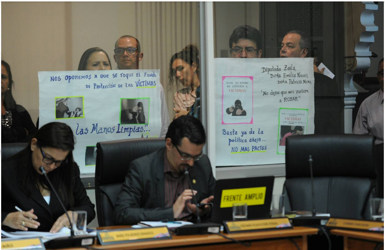
Las familias tuvieron apoyo en la Asamblea y eso permitió que la ley se aprobara. (Melissa Fernández)

Ella aseguró que después de que la ley se aprobó, por casi dos años tuvo que ir a los juicios para