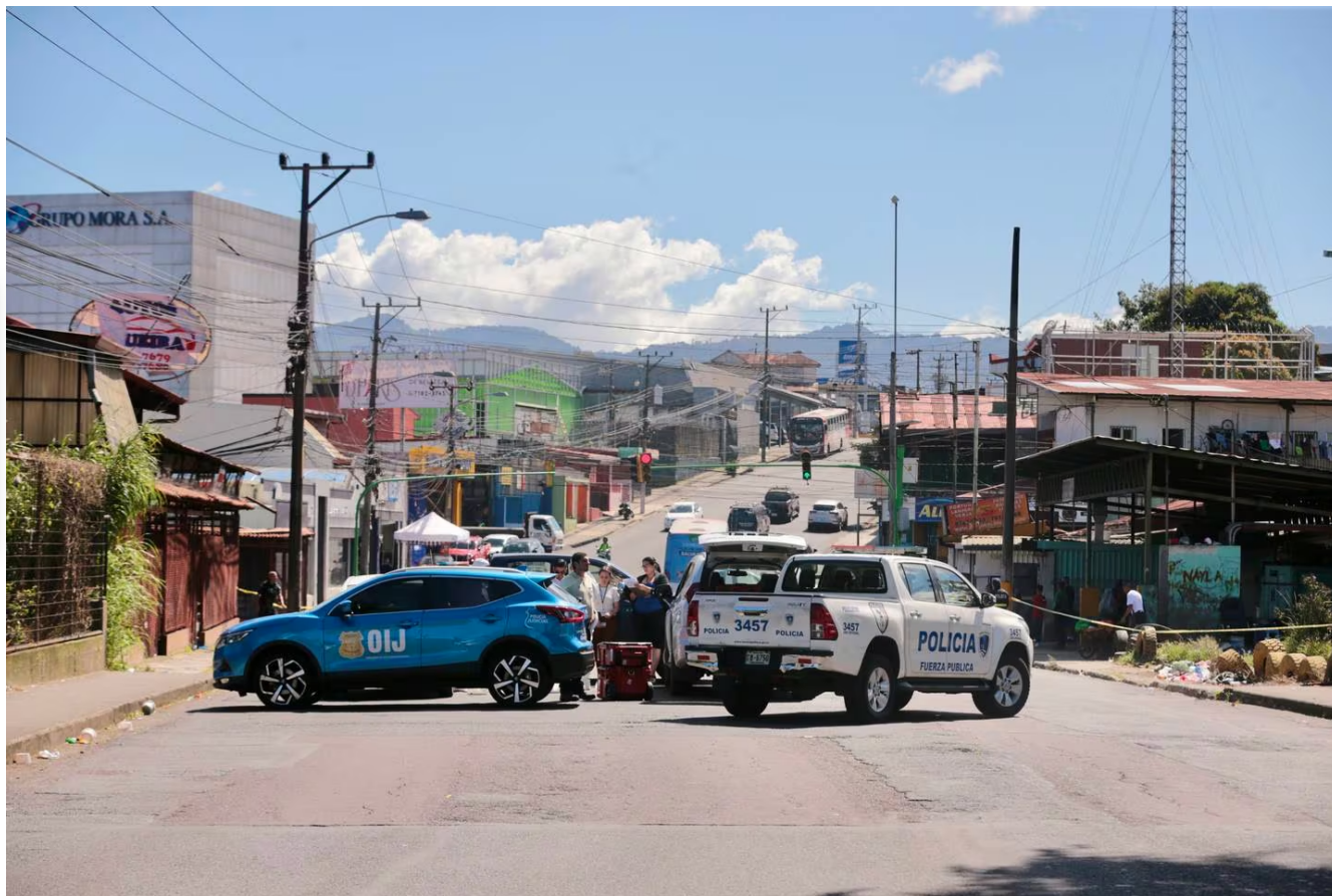
Un hombre fue baleado el 4 de diciembre en San Sebastián (San José). Para la Defensoría es crítico fortalecer a los cuerpos policiales debido al repunte de homicidios este año.

La Defensoría de los Habitantes alertó este martes que el estado de los derechos humanos en Costa Rica podría retroceder en el 2024 debido al agravamiento de problemáticas en materia de seguridad ciudadana, salud, educación y discriminación.