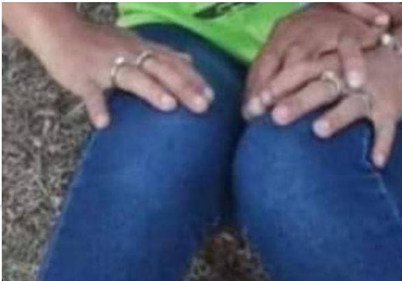
Juliana Diermissen Noel habría sido asesinada por su pareja, su cuerpo no aparece.

El tipo se mantiene en fuga y es buscado desde noviembre anterior, al no saber el paradero de él, se desconoce qué hizo con Juliana, quien estaba viviendo en Pococí cuando se le perdió el rastro.