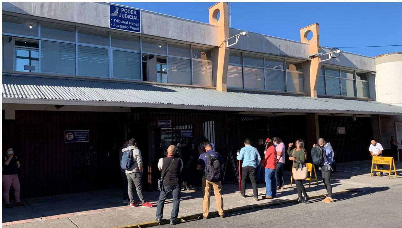
Los hechos se juzgaron en el Tribunal Penal de Desamparados (José Coder)

En noviembre pasado, un hombre fue condenado a seis años y ocho meses de cárcel por violar a una adolescente de 15 años.