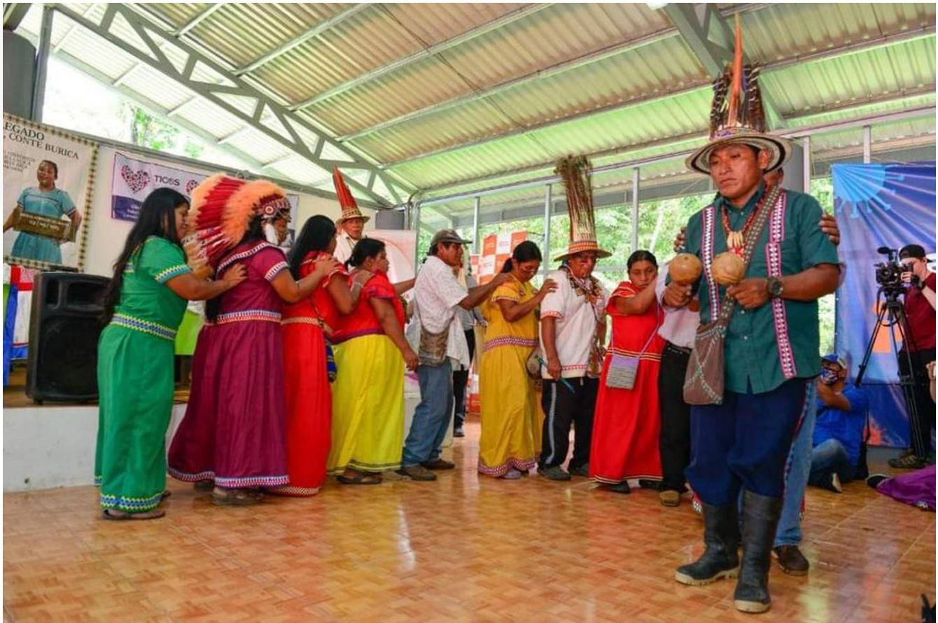
La ceremonia duró aproximadamente dos horas y hubo bailes típicos. En la foto se aprecia a la cacique usando su penacho.

No obstante, tiene claro que esta es la menor de sus preocupaciones, pues el pueblo indígena tiene muchas necesidades y retos.