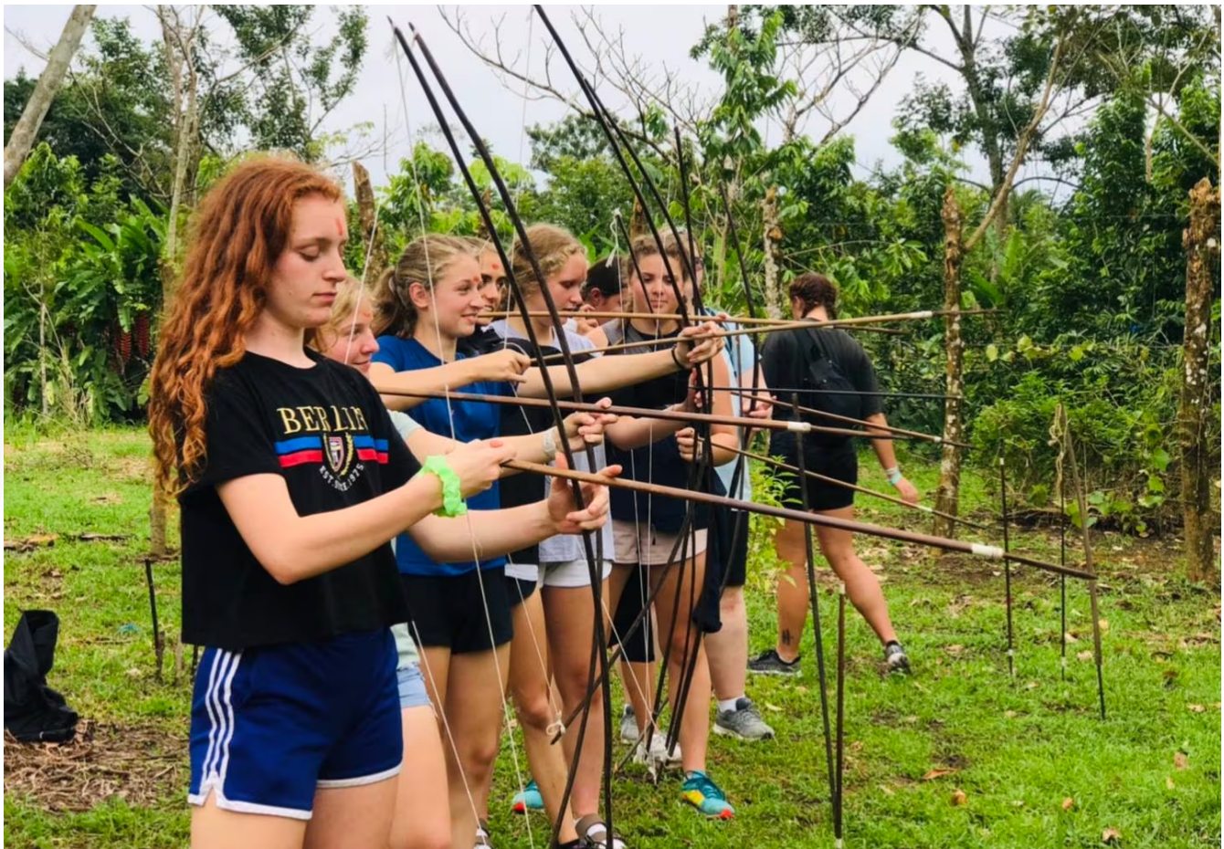
Los visitantes al palenque El Sol en Guatuso, aprenden y conocen de primera mano sobre la cultura maleku.

¿Qué hacen? Dan charlas en las que se explica cómo fue la vida de los malekus antes, cómo viven en la actualidad y cómo han enfrentado los cambios.