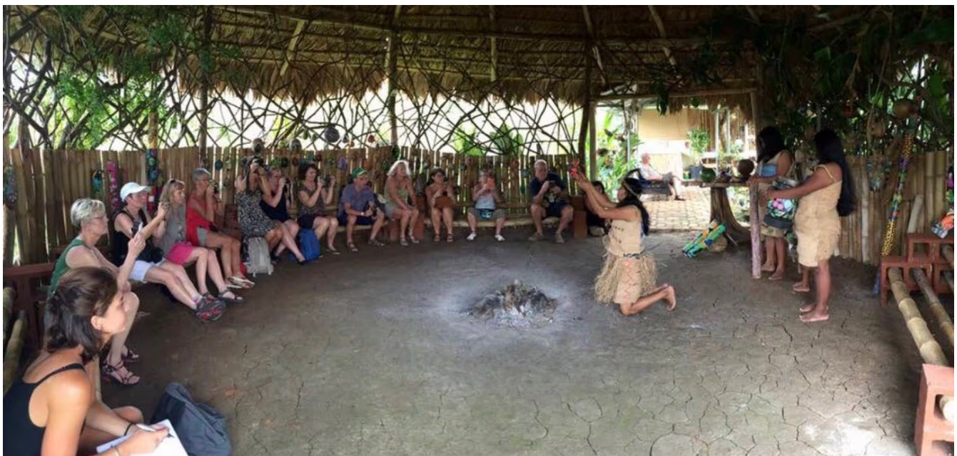
En el Rancho Maleku Tafa Urijif, en el palenque El Sol, en Guatuso, se realizan visitas guiadas donde las personas pueden participar en una ceremonia espiritual junto a los indígenas malekus.

Históricamente, la mujer indígena es la transmisora del conocimiento y la encargada de mantener la vigencia de su cultura por medio de la tradición oral y la enseñanza de los conocimientos artesanales. A esto se le suma, la educación de los hijos en el valor, el amor y el respeto por la tierra que los refugia y los alimenta. Hiqui lleva con honor esta labor y, para ello, la tecnología es su aliada.