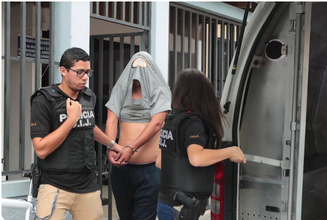
Aunque inicialmente se les dejó libres, con tobillera electrónica, días después se les dictó prisión preventiva debido a una apelación que hizo la Fiscalía. Foto: