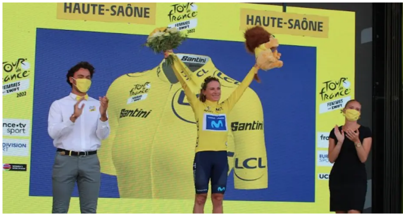
Annemiek van Vleuten.