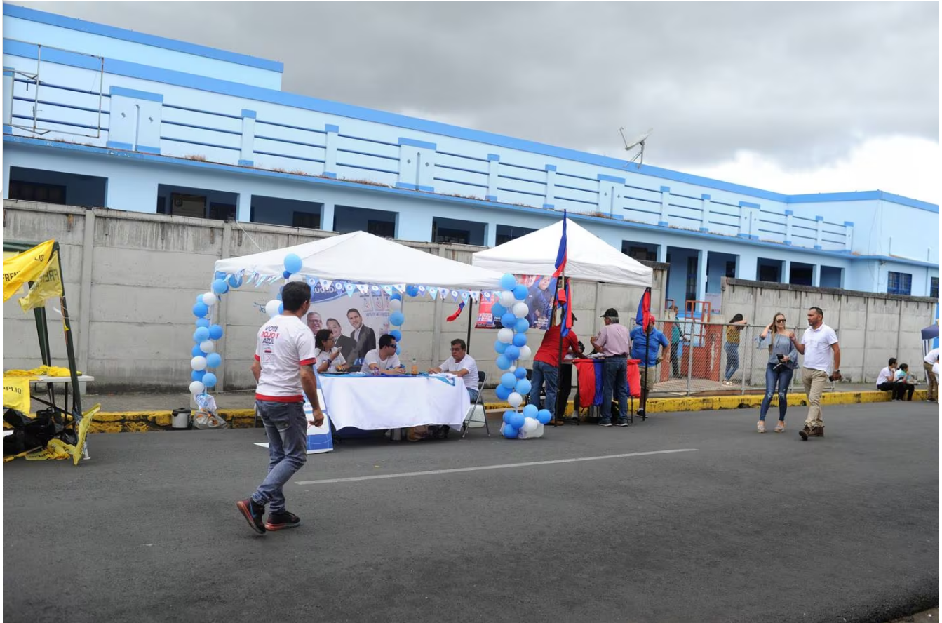
Las elecciones municipales se realizarán el 4 de febrero del 2024.

“Esta capacitación podría tener una formación básica en derechos humanos y violencia basada en género, por la responsabilidad que van a tener en el poder público”, afirmó.