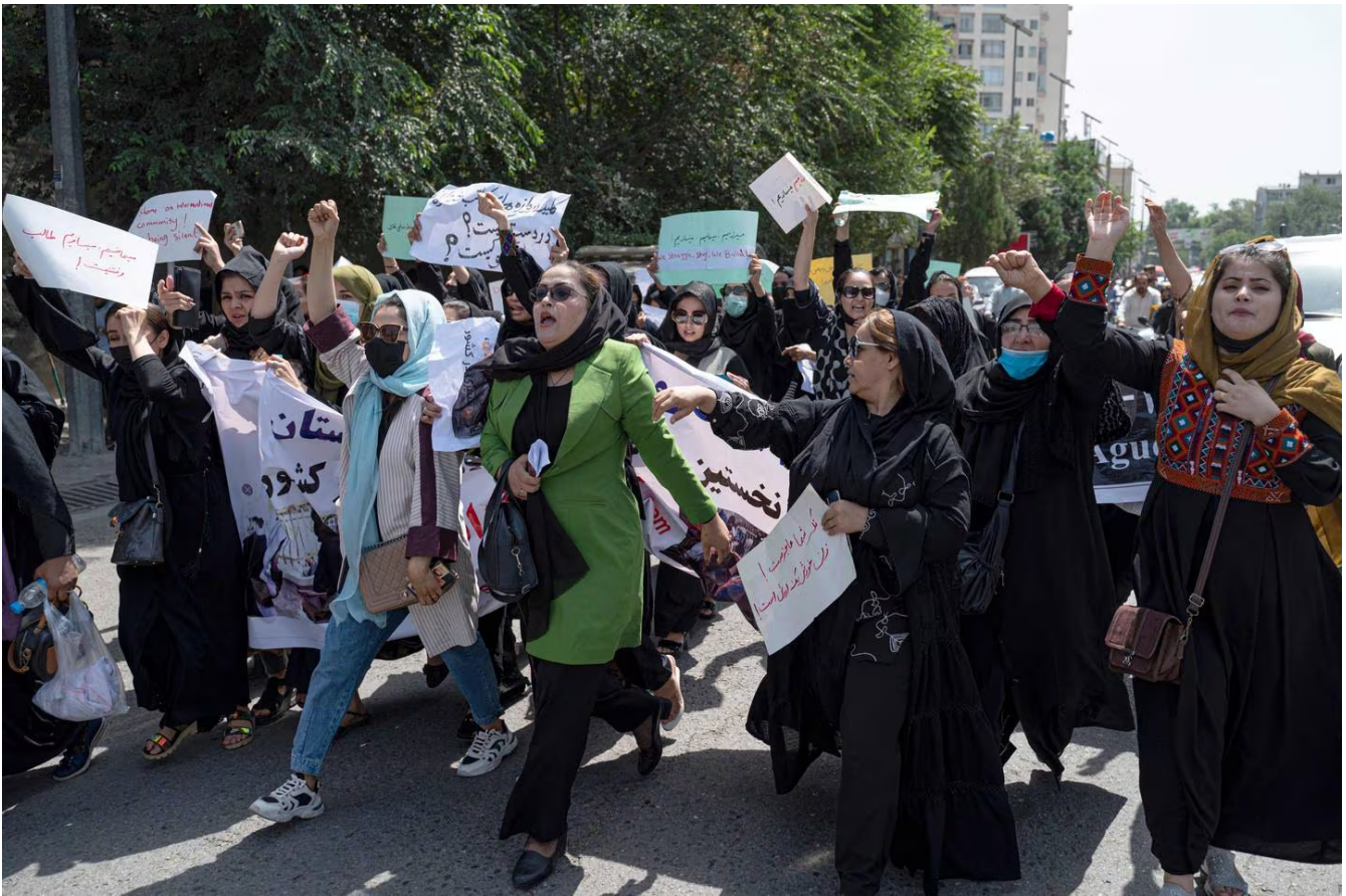
Las mujeres afganas sostienen pancartas mientras marchan y gritan "Pan, trabajo, libertad", durante una protesta por los derechos de las mujeres en Kabul el 13 de agosto del 2022.