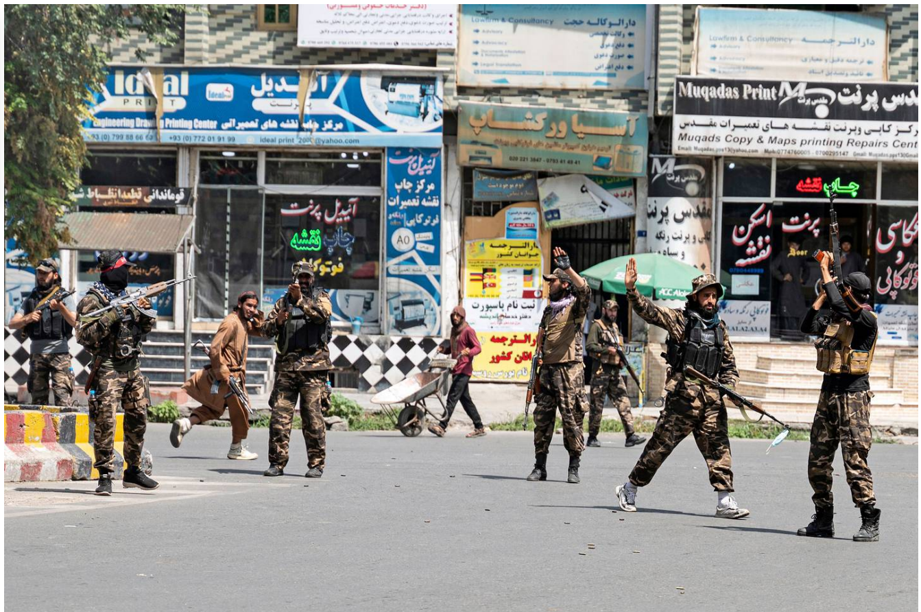
Los combatientes talibanes disparan al aire para dispersar a las mujeres afganas que protestan en Kabul el 13 de agosto del 2022.

En las dos últimas décadas, las afganas habían ganado libertades, volviendo a la escuela o solicitando puestos de trabajo en todos los sectores. Actualmente, se han visto apartadas de la mayoría de empleos públicos o han recibido recortes salariales y la orden de quedarse en casa.