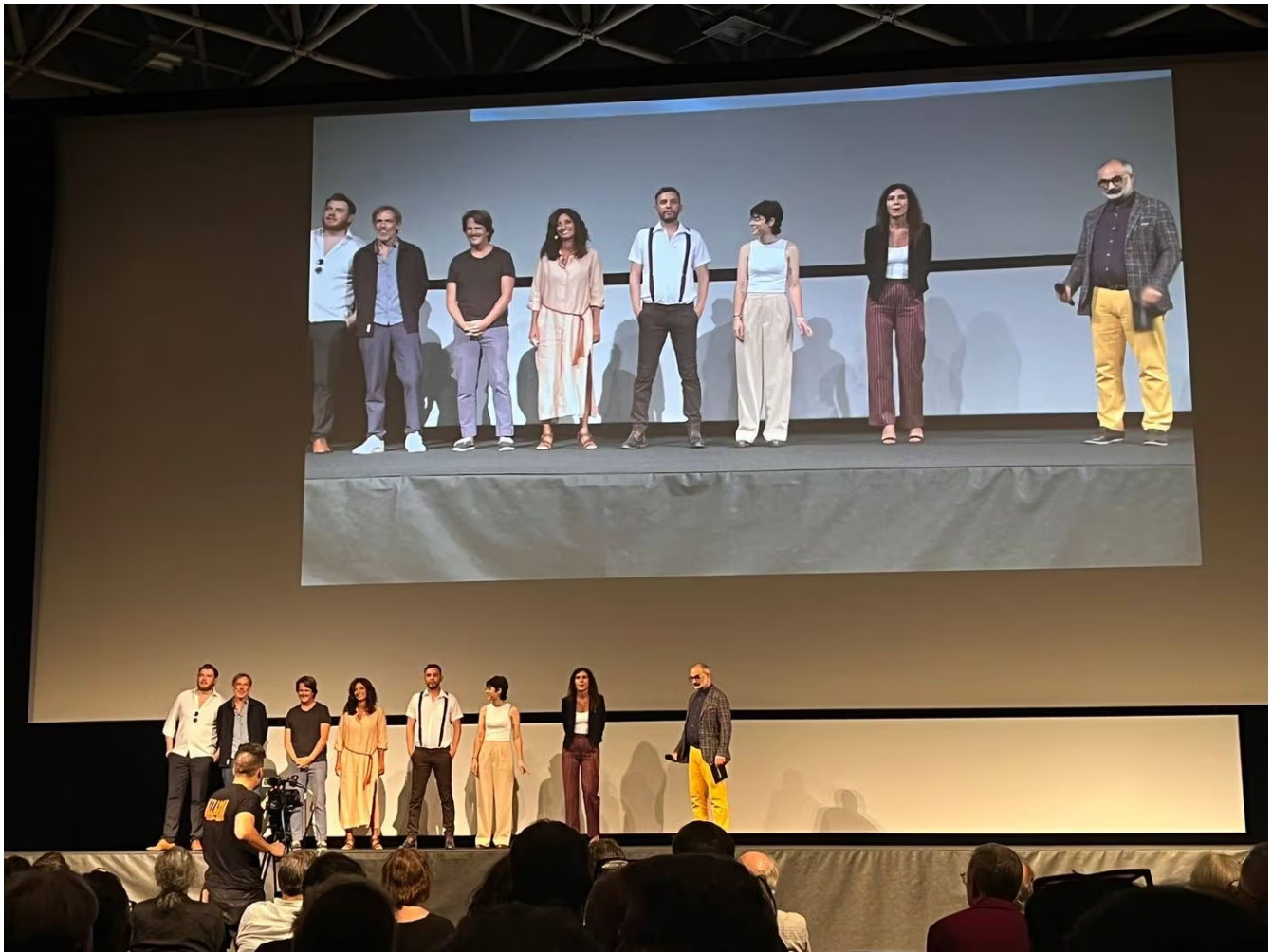
Esta fotografía pertenece al día del estreno de 'Tengo sueños eléctricos'. La cinta fue ovacionada.