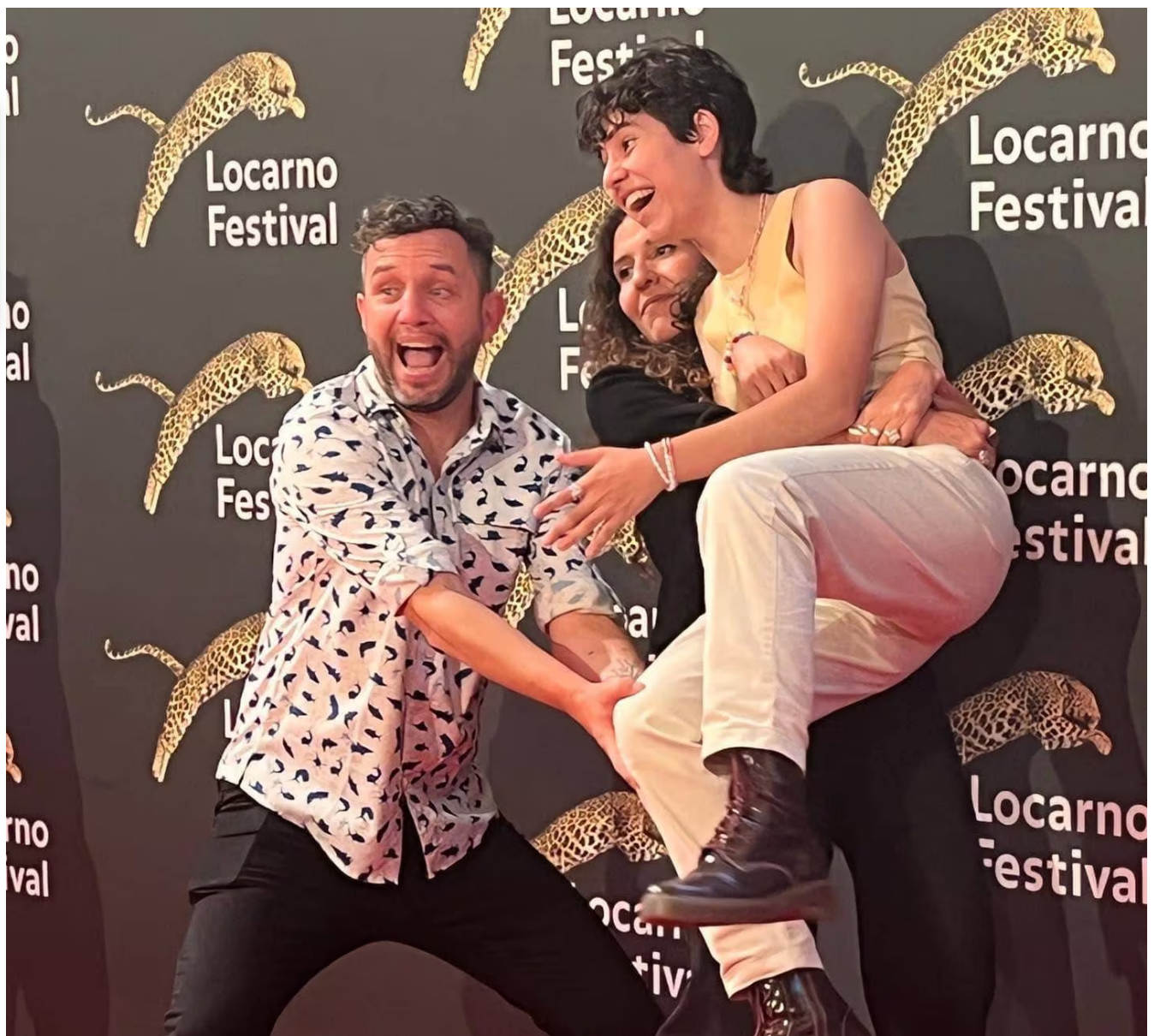
El trío de talentos ticos festejó a lo grande en la alfombra de reconocimientos del Festival de Locarno.

"El mensaje es 'sigan'. Queremos que hagan más películas, que sigan actuando. Estos premios son para la peli, para nosotros, pero sobre todo para el cine tico. Porque esta película es tica y fue apoyada por el fondo El Fauno, pero es una coproducción con Bélgica y Francia y fue difícil lograr que fuera una coproducción de Costa Rica porque no existen suficientes fondos, ni tratados de coproducción con Europa", explica.