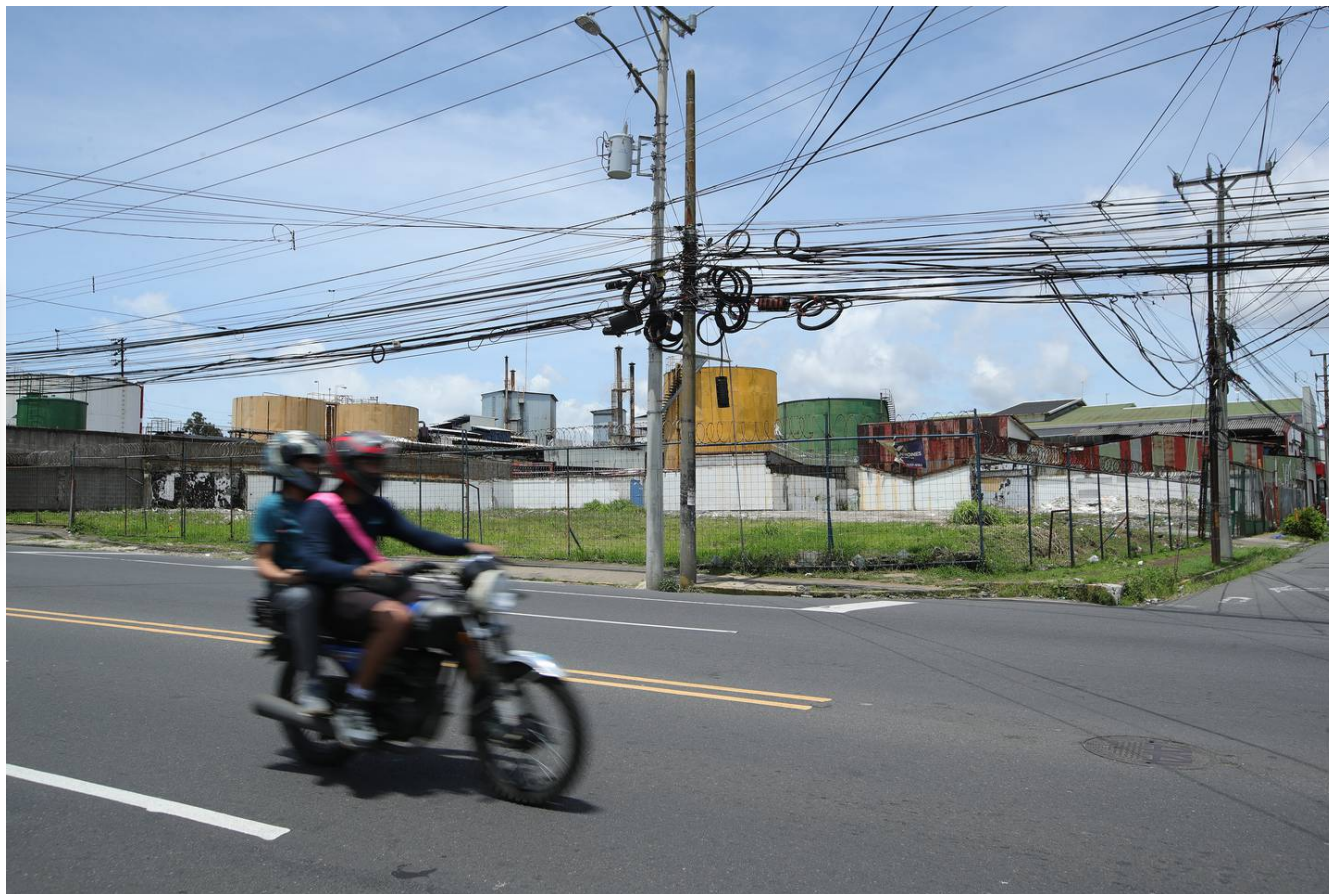
La violación se registró en un lote baldío ubicado al frente de las instalaciones de Leonisa, en barrio Cuba. Foto con fines ilustrativos (JOHN DURAN)

La decisión también destaca que la violencia durante los hechos a la que hizo referencia la ofendida fue respaldada con el dictamen médico legal, el criminalístico y el informe de un perito médico. Los informes confirman la violación, por la presencia de semen en la vagina de la mujer y ADN en su mama izquierda, así como excoriaciones en la mejilla derecha, labio inferior, muslo y pierna derecha y muslo izquierdo.