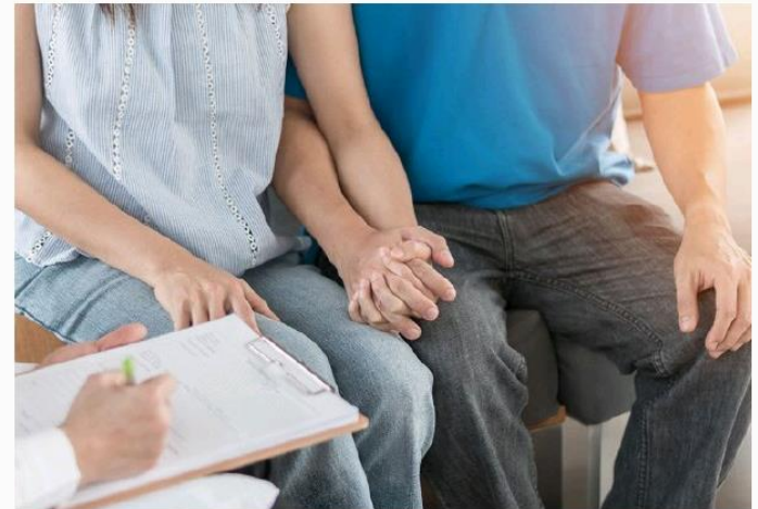
Cada 1.º de diciembre se conmemora el Día Mundial de la Respuesta al VIH.

a población adolescente, joven y adulta desde finales de octubre. Se prolongarán hasta la primera semana de diciembre con temas como la prevención, habilidades