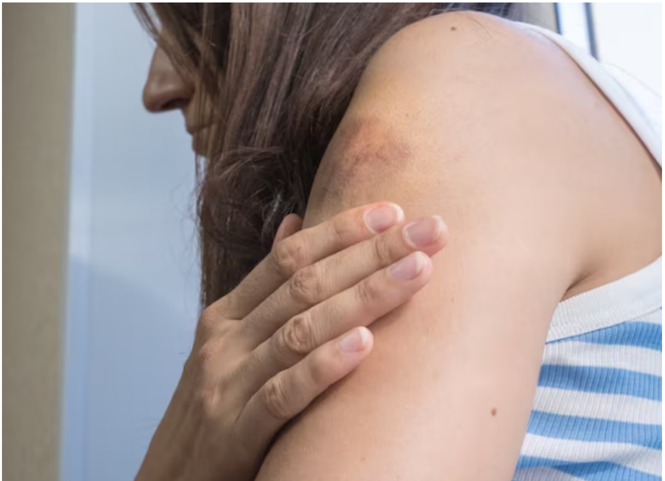
Las agresiones son situaciones que pueden generar un trastorno de estrés postraumático.

En cuanto a las repercusiones emocionales, la psicóloga destacó que las agresiones son situaciones que pueden generar un trastorno de estrés postraumático, por lo que es importante el abordaje integral inmediato, involucrando tanto al sistema de salud pública como al sistema judicial, para brindar apoyo y contención a las víctimas.