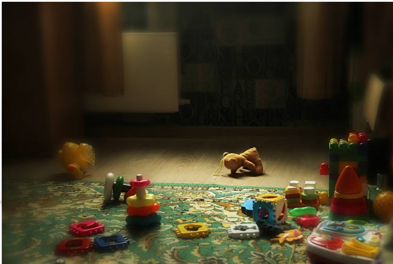
Los hechos ocurrieron en el 2012 en Cañas Dulces de Liberia. Foto con fines ilustrativos.