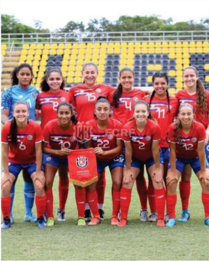
La joven (#2) tiene muy claro el panorama.

por eso se necesitaba toda su atención en los preparativos que exige la competencia.