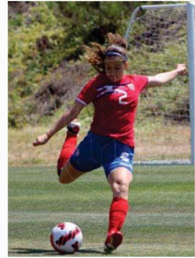
La ilusión del equipo está al tope.