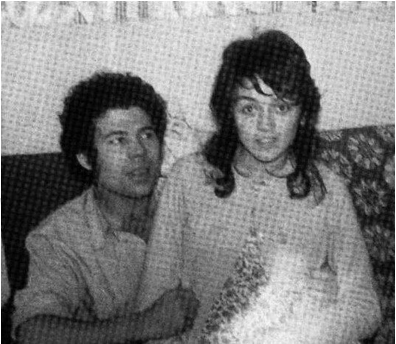
Esta foto es de los inicios de la pareja asesina.

Encontró en ella el complemento perfecto para su mente retorcida. Con una amplia experiencia sexual y un gran interés por la pornografía y las perversiones, la pareja no dudó en contraer nupcias. En 1971, Heather nació como la primera hija de este dúo. Con la llegada de la niña, Fred tomó la decisión de matar a Rena y Charmaine.