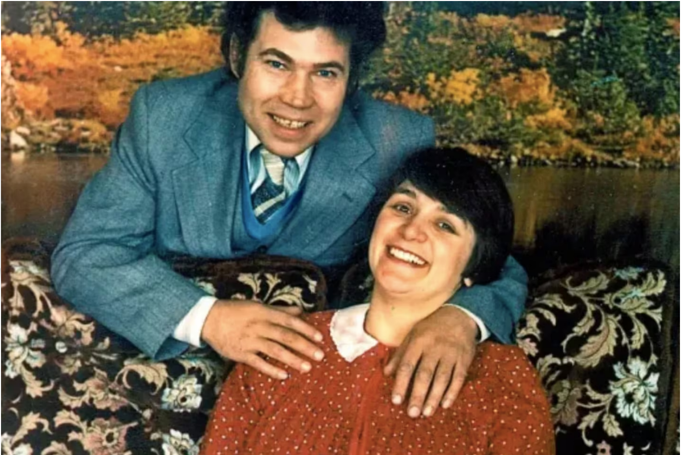
Cualquiera que los ve pensaría que eran buenas personas, pero mataron a 12 jóvenes.

Pero Fred West y su esposa Rosemary serían la prueba de que hasta los lugares más prometedores esconden oscuros y macabros secretos. La pareja, que residía en una finca de Cromwell Street, en la capital del condado de Gloucestershire, demostró que hasta los más indefensos pueden llegar a convertirse en asesinos despiadados.