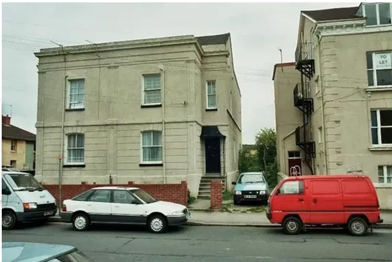
En esa casa es donde se cometieron los horrores.